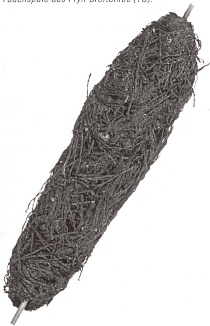
Fadenspule aus Pfyn-Breitenloo (TG).

Festumzüge, Schulbücher und Präsentationen an den Weltausstellungen in Paris und Wien. Besonders die Pfahlbautextilien und die qualitätvollen Artefakte erregten grosses Aufsehen, liess sich doch damit ein direkter Bezug zur führenden Textil- und Maschinenindustrie der damaligen Zeit herstellen. Gerne übersah man dabei, dass Pfahlbauten auch in Italien, Frankreich, Deutschland, Österreich und Slowenien entdeckt wurden; insgesamt 111 Fundstellen rund um die Alpen sind übrigens seit 2011 auf der Unesco-Welterbeliste.