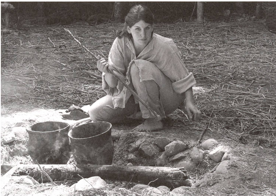
Szenenbild aus den «Pfahlbauern von Pfyn».

können ( www.horizont2015.ch ). Auch die über 100-jährige Gesellschaft Archäologie Schweiz mit ihren international anerkannten Publikationen sorgt erfolgreich für eine Bündelung der föderalen archäologischen Forschungsergebnisse. Dieser Verein ist zudem Mitglied von NIKE und Alliance Patrimoine – Organisationen, die sich als Anwältinnen des kulturellen Erbes gegenüber der Politik und Öffentlichkeit verstehen.