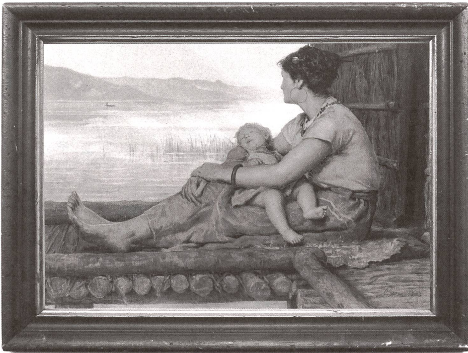
Albert Anker, die Pfahlbauerin (1873). Öl auf Leinwand.