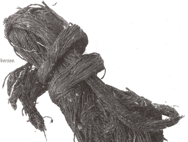
Schnurknäuel aus Wetzikon-Robenhausen (ZH) am Pfäffikersee.

ten Römer Museen in Manching (D) und dem Museum für keltische Zivilisation in Bibracte (F) belegen. Weitere positive Beispiele interdisziplinärer und überregionaler Zusammenarbeit bilden archäologische Projekte, die unter anderem vom Schweizerischen Nationalfonds finanziell gefördert werden.