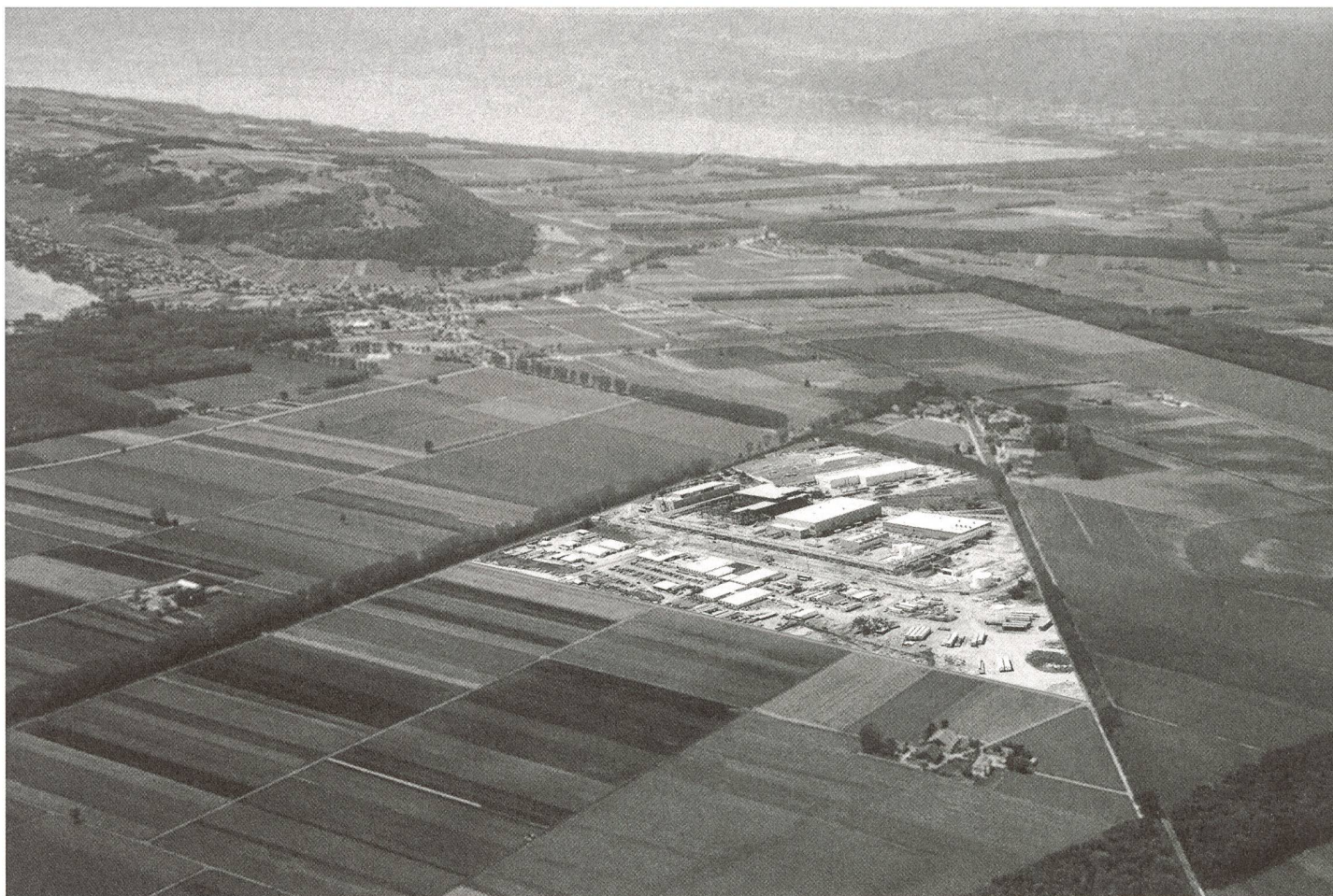
Landschaft als Restfläche: Die Chemiefabrik, wie sie im Galmiz Moos gemäss der 2004 über Nacht ausgeschiedenen Industriezone hätte entstehen können. (Fotomontage)