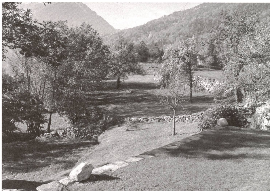
«Trivialisierung der Landschaft».

Obst- und Mähwiesen im alpinen Piemont: Wir zehren vom «Mehrwert» der Landschaft, den uns frühere Generationen durch ihre Arbeit mit den vorhandenen Naturgegebenheiten hinterlassen haben.