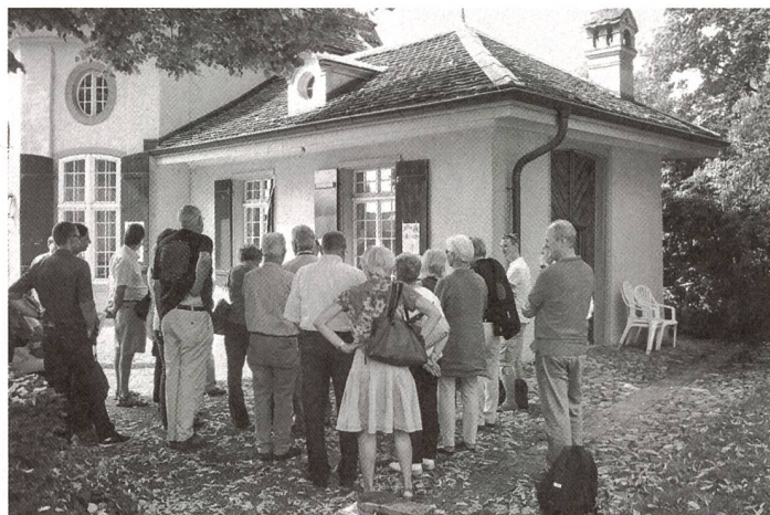
... staunen. ... être étonné.

Le grand succès des journées européennes du patrimoine est stimulation et motivation à s'engager avec