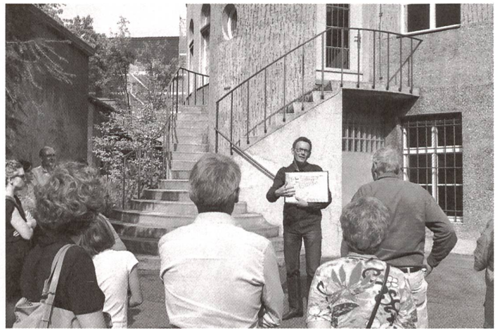
... zuhören... ... écouter...

Das grosse Interesse an den Europäischen Tagen des Denkmals ist Ansporn und Motivation, sich für die Erhaltung unseres reichen kulturellen Erbes mit Begeisterung