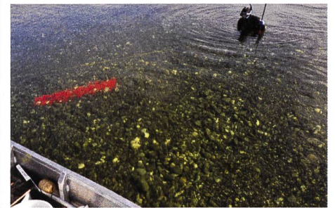
Abdeckmassnahme in der Pfahlbausiedlung Steckborn-Schanz am Bodensee. Mit eingemessenen, bunten Markern konnte ein Erosionsmonitoring durchgeführt werden.

Internationale Verträge wie beispielsweise die London- oder die La Valetta-Konvention rufen auf zur Konservierung und Bewahrung des archäologischen Erbes – und zwar nach Möglichkeit in situ (= an der Fundstelle). Seit 1996 werden die vielfältigen Forschungsergebnisse von in situ -Konservierungen in einer Reihe internationaler Konferenzen unter dem Namen «Preserving Archaeological Remains in situ (PARIS)» diskutiert und vorgestellt. Bisherige Austragungsorte waren London (1996 und 2001), Amsterdam (2006) und Kopenhagen (2011). Das 5. Symposium findet vom 13. bis 17. April 2015 in Kreuzlingen im Kanton Thurgau statt, organisiert wird die einwöchige Tagung durch das Amt für Archäologie des Kantons Thurgau.