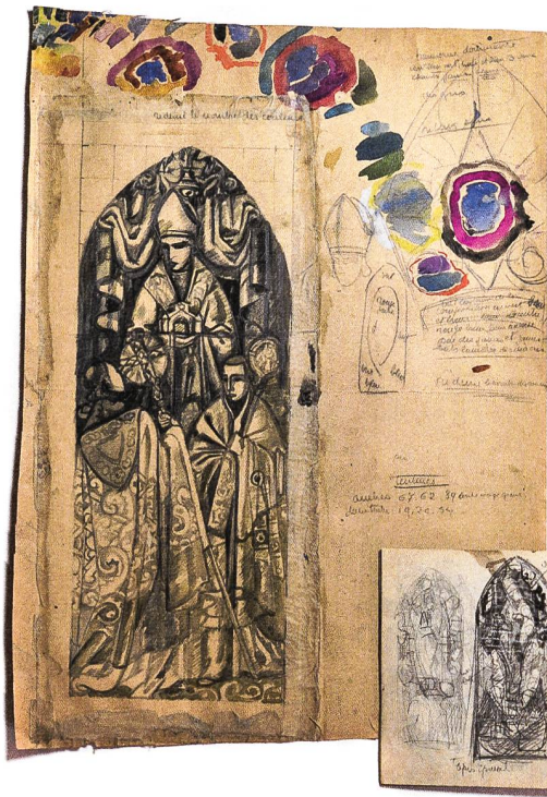
Fig. 4: Maquette, carnet d'esquisses et correspondance, fonds Marcel Poncet (dépôt à long terme des descendants).

du Corpus Vitrearum. C'est également grâce à la collaboration et la coopération développées avec d'autres institutions nationales ou internationales que cet objectif pourra être atteint, notamment par la création de schémas et de normes d'échanges de données, initiative pilotée par le Vitrocentre. Ceci favorisera le partage d'informations dans le monde scientifique international et pourra aboutir à des résultats de recherches communs. Malgré l'importance des technologies du web et des opportunités qu'elles nous apportent, nous restons toujours prêts à saisir notre bâton de pèlerin pour aller à la quête de fonds en danger qui relatent l'histoire de notre patrimoine verrier, source essentielle de notre activité.