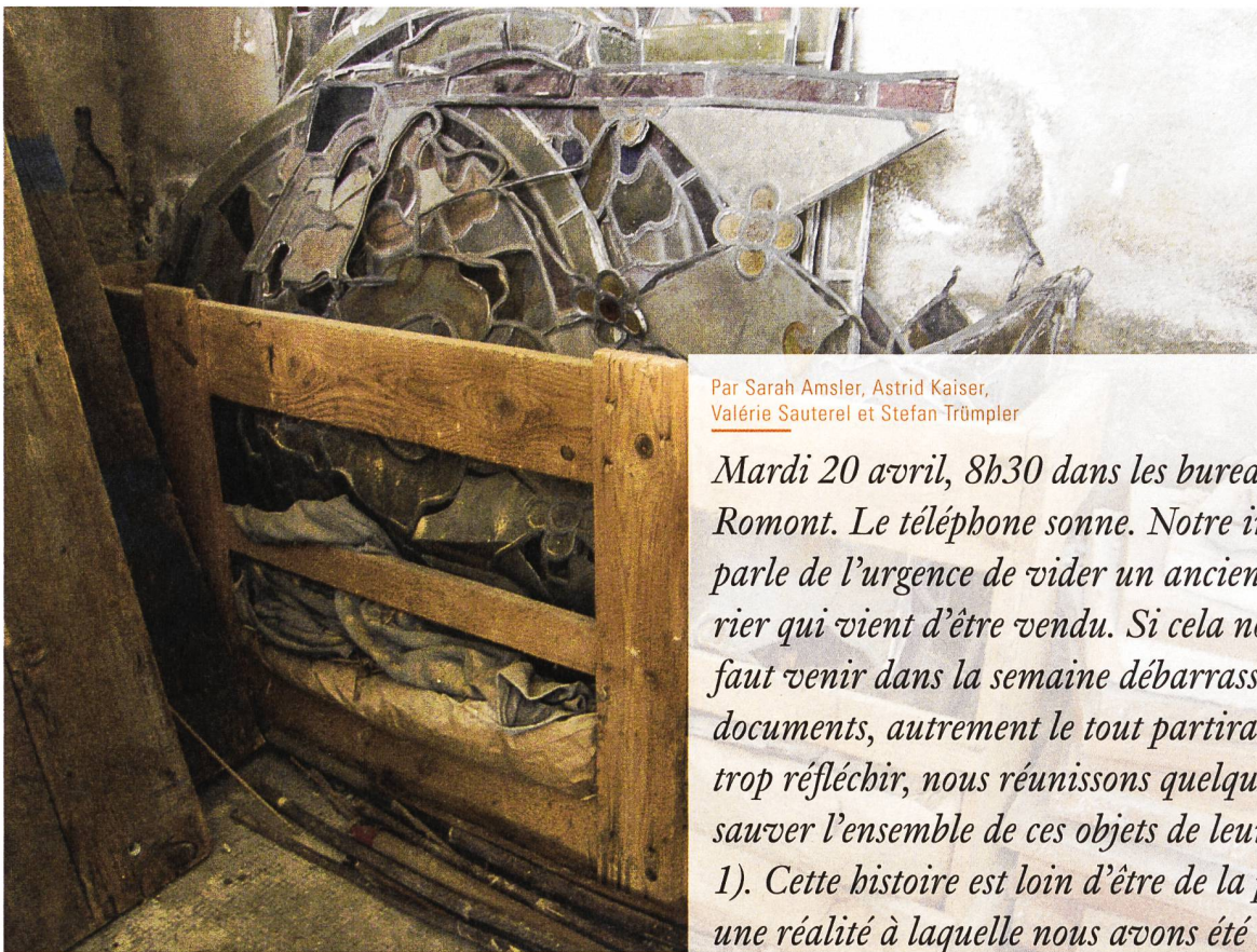
Fig. 1: Vitraux du XIX e siècle entassés dans une caisse. Exemple de découvertes faites dans des greniers, caves ou hangars.

Par Sarah Amstler, Astrid Kaiser, Valérie Sauterel et Stefan Trümpler