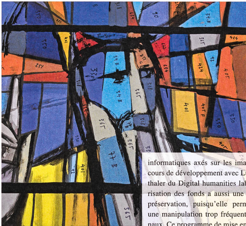
Fig. 3: Bodjol, Moïse (détail), 1972. Carton pour le vitrail du temple de Vandœuvres, fonds Bodjol.