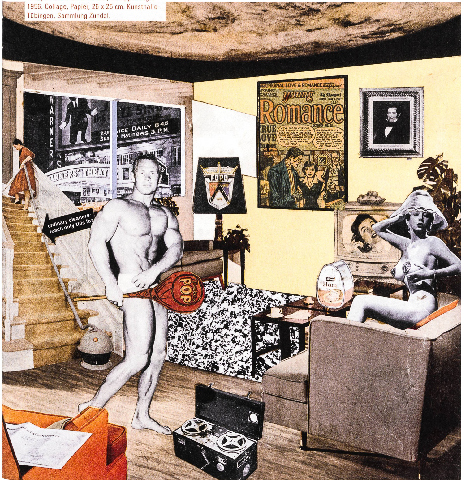
Richard Hamilton: Just What Is It That Makes Today's Homes So Different, So Appealing?, 1956. Collage, Papier, 26 x 25 cm. Kunsthalle Tübingen, Sammlung Zundel.