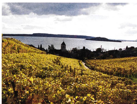
Europäisch ausgezeichnet: die aufwändige Rebflurbereinigung von Twann-Tüscherz.

Im Rahmen der Verleihung des Europäischen Dorferneuerungspreises 2014 Mitte September erhielt das Waadtländer Dorf Château-d'Oex einen Preis für eine ganzheitliche, nachhaltige und mottogerechte Dorfentwicklung von herausragender Qualität. Das Bernische Twann-Tüscherz wurde mit einem Preis für besondere Leistungen in mehreren Bereichen der Dorfentwicklung ausgezeichnet. Insgesamt wurden 29 Wettbewerbsprojekte aus Österreich, Deutschland, der Niederlande, Tschechien, Ungarn, Luxemburg, Polen, Italien, Bulgarien, Slowakei, Belgien und der Schweiz prämiert.