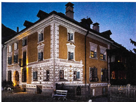
Vom Patrizierhaus zum Hotel: Die Chesa Salis in Bever ist Historisches Hotel des Jahres 2015.

Zum neunzehnten Mal hat die ICOMOS-Arbeitsgruppe «Historische Hotels und Restaurants» in Zusammenarbeit mit hotellerieuisse, GastroSuisse und Schweiz Tourismus den Preis für das «Historische Hotel des Jahres» verliehen. Das Hotel und Restaurant Chesa Salis in Bever (GR) wurde als «Historisches Hotel des Jahres