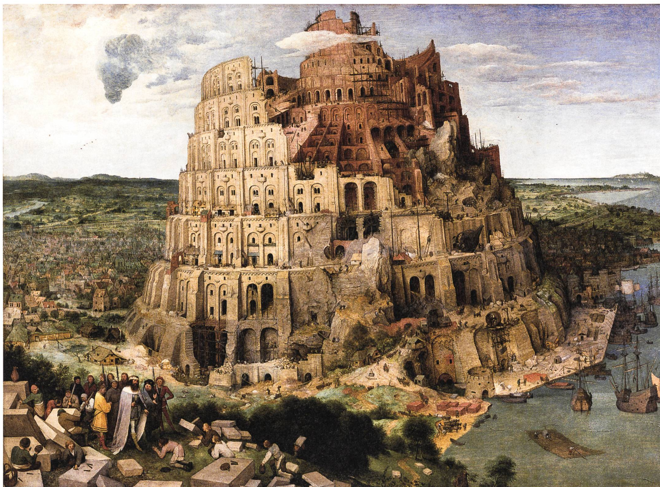
Pieter Bruegel d. Ä., Turmbau zu Babel, 1563