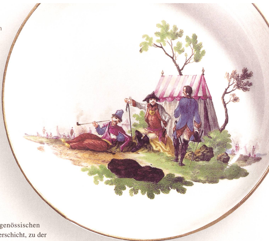
Detail Untertasse, Christian Friedrich Kühnel (zugeschr.), um 1770 (?).

lade Romaine» (Lattich), mit Mandelkernen und Frankfurter Bier. Dafür erreichten Entlebucher Butter, «Glarner Tee» aus einheimischen Kräutern, Greyerzer Käse oder Morcheln und Maipilze aus den Freibergen die Dienstorte der Schweizer.