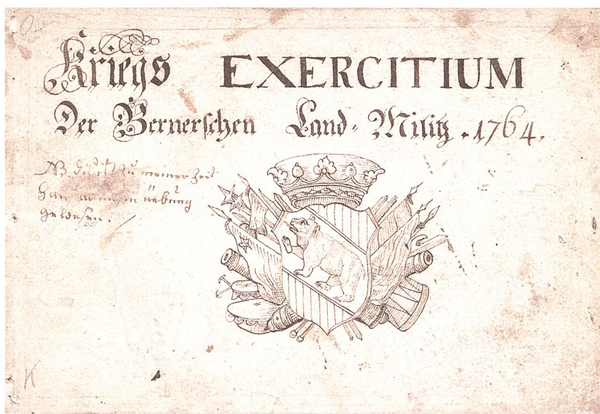
Kriegs-Exercitium der Bernischen Land-Miliz, 1764.