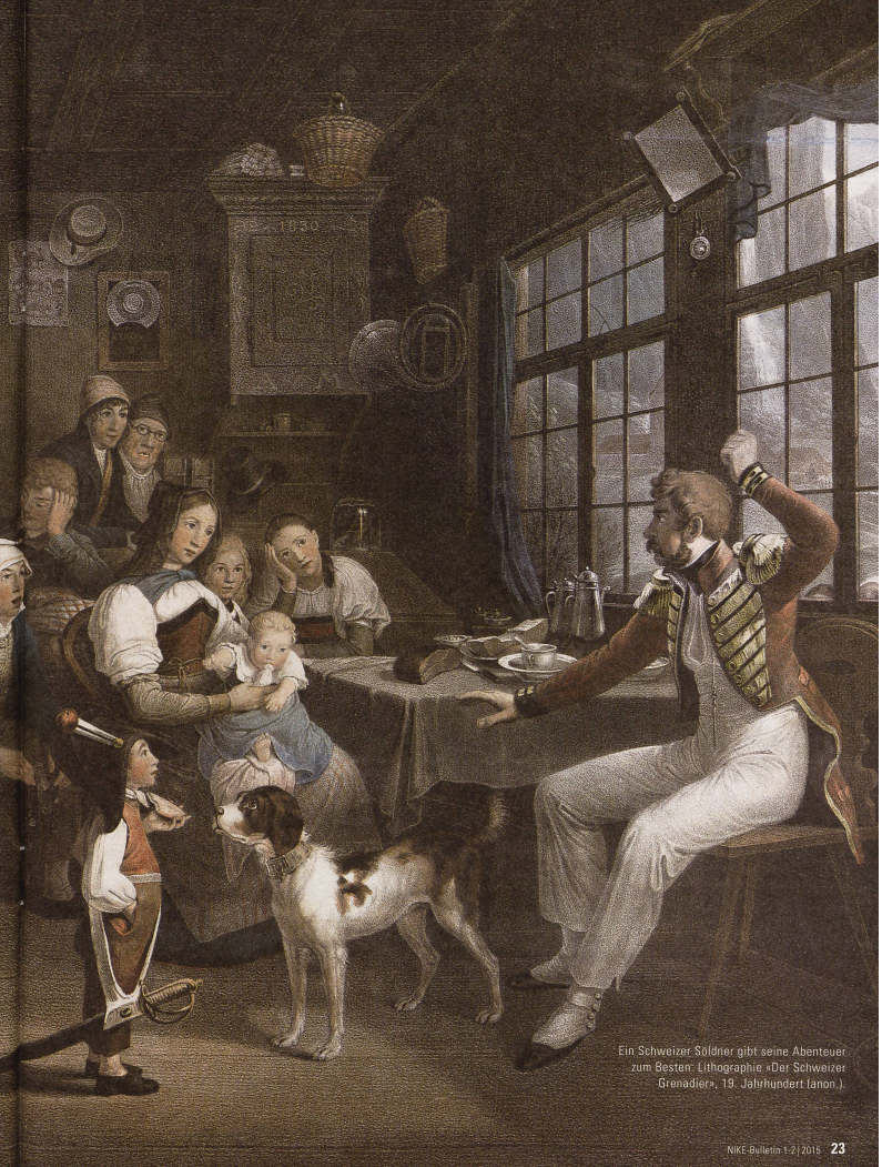
Ein Schweizer Söldner gibt seine Abenteuer zum Besten: Lithographie «Der Schweizer Grenadiere», 19. Jahrhundert (anon.).