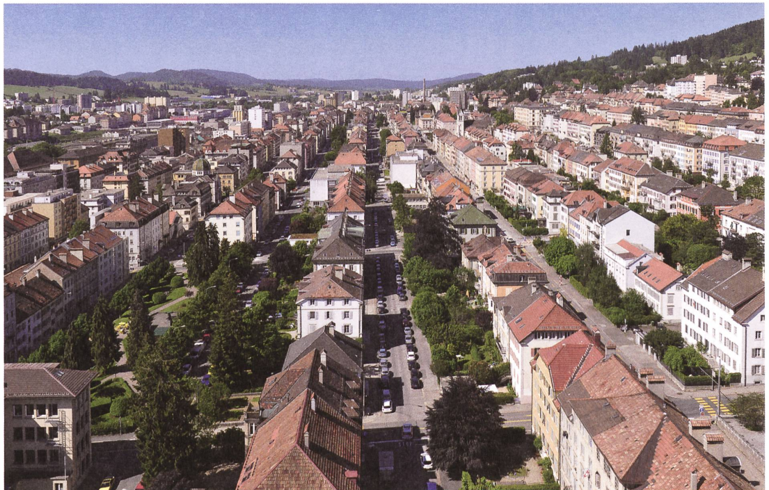
Häuser, Gärten und Strasse an der rue de la Paix.