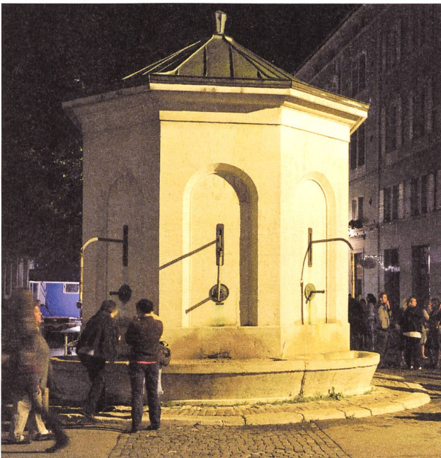
Die Fontaine de six pompes diente der Wasserversorgung vor dem Bau der grossen Trinkwasseranlage aus der Areuse.