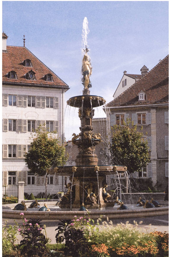
Der grosse Springbrunnen am Anfang der Avenue Léopold Robert, der an den Beginn der Wasserversorgung 1887 erinnert.