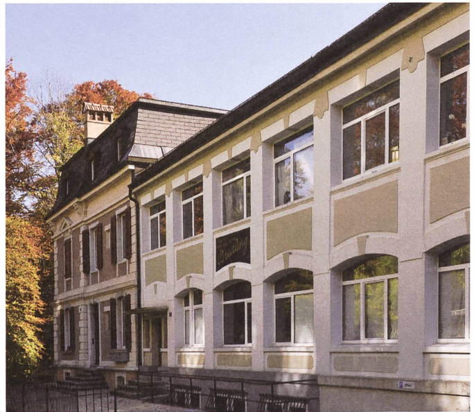
Uhrenfabrik Coulleru Meuri, seit 1892 Léon Breitling, rue Monbrillant 1-3. An das Bürohaus schliesst die Fabrikantenvilla an; Architekt Eugène Schaltenbrand (1861– ca. 1930).