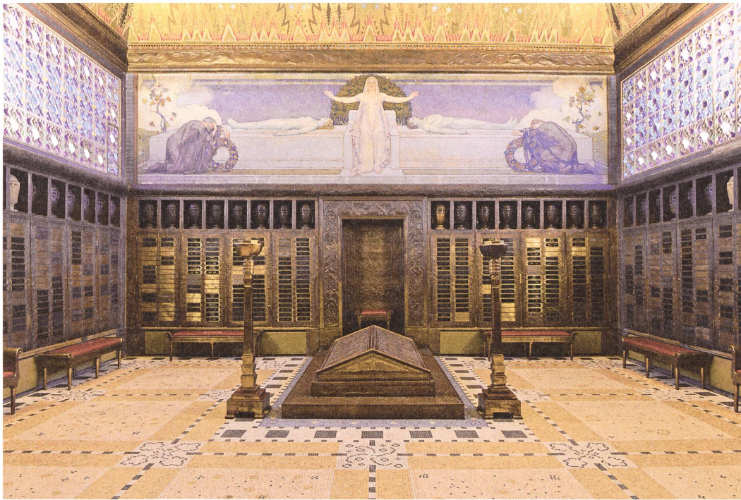
Das Innere des Krematoriums auf La Charrière, gestaltet 1908–1909 von Charles L'Éplattenier und den Ateliers de l'art réunis.