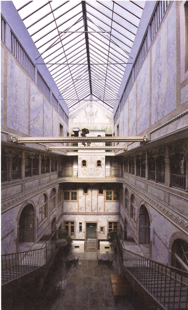
Ancien manège, 1868 in die ehemalige Reithalle von 1862 eingebaut, bis 1972 als «Famillistère» bewohnt und 1985 vor dem Abbruch gerettet. Blick in den 1992–1994 restaurierten Innenhof.