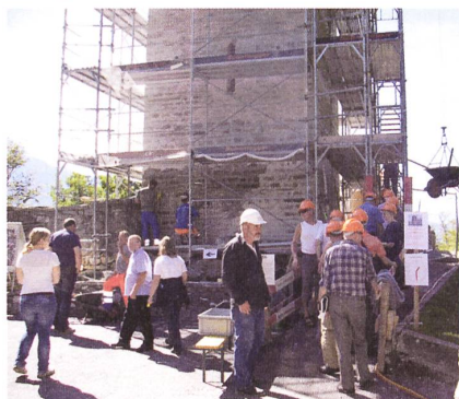
Helm auf zur Besichtigung der Burgruine Ringgenberg (BE).

Das auf den ersten Blick abstrakte, aber überraschend vielfältig ausgelegte Thema lockte viele Neugierige an, so dass an den Veranstaltungen insgesamt 50 000 Besucherinnen und Besucher gezählt wurden. Die Veranstaltenden zeigten sich zufrieden mit dem erfreulich grossen Zuspruch. Vielerorts wurde festgestellt, dass die Besucher nicht nur aus der näheren Umgebung kamen, sondern auch längere Anfahrtswege nicht gescheut hatten.