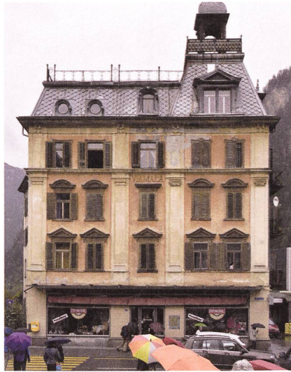
L'ancien hôtel Via Mala à Thusis (GR) hébergeait les voyageurs avant (ou après) de traverser la gorge du même nom.

posé dans le Tösstal, ou partir en promenade à travers la ville de Zurich, pour y découvrir des influences architecturales provenant d'Helsinki ou de Chicago?