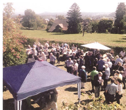
Stark frequentierte Anlaufstelle: der Infostand der Denkmalpflege Schaffhausen.

Kultur BAK und der Schweizerischen Akademie der Geistes- und Sozialwissenschaften SAGW. Weitere Partner waren der Bund Schweizer Architekten BSA, die Ernst Göhner Stiftung, die Gesellschaft für Schweizerische Kunstgeschichte GSK, die Mobiliar, der Schweizerische Ingenieur- und Architektenverein SIA, der Schweizerische Verband für Konservierung und Restaurierung SKR und die Schweizerische UNESCO-Kommission.