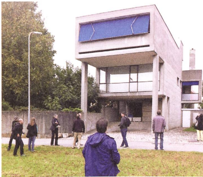
Sur les traces des influences de Le Corbusier dans l'architecture tessinoise.

Les participants aux Journées ont pu constater à quel point notre culture est ancrée dans le contexte des échanges mondiaux. Au château d'Oberhofen, ils ont appris comment un salon inspiré par l'architecture du Caire a pu être construit en plein Oberland bernois, tandis qu'à Schafisheim (AG), ils ont marché sur les traces des Huguenots qui, il y a trois siècles, se réfugiaient en Suisse, où ils allaient profondément influencer la vie économique et intellectuelle