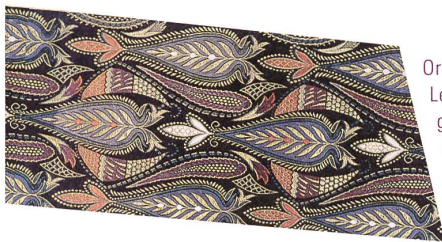
Orientalische Palmetten, Lebensbäume; Jacquardgewebe, Satin, Seide und Goldfäden, 1916: Der schwarze Grund lässt die kostbaren eingewobenen Goldfäden glänzen.

schmutzung des Rheins, und die gesundheitlichen Risiken für die Arbeiter waren gross. Wie die Seidenbandweberei verlor auch die Farbenproduktion in der Region Basel seit dem frühen 20. Jahrhundert zunehmend an Bedeutung. Der internationale Konkurrenzdruck wuchs, der sinkende Stern der Textilindustrie blieb auch für die Farbproduktion nicht folgenlos. Mitte des 20. Jahrhunderts erlitt die Konjunktur in der Farbbranche einen empfindlichen Knick, andere Produkte gewannen an Bedeutung. Aus den ursprünglich farbproduzierenden Chemie-Firmen Sandoz, Ciba, Geigy und der schon seit jeher vorwiegend Medikamente herstellenden Hoffmann-La Roche wurden durch Fusionen und Erweiterungen weltweit erfolgreiche Konzerne wie Novartis oder Roche. Heute liegen die Kerngeschäfte dieser Betriebe in der Pharmabranche und dem Bereich Life-Sciences, in der Region wird kaum noch Farbe produziert.