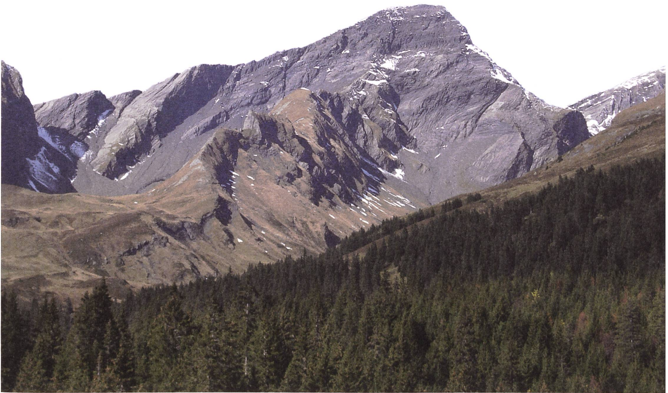
Das Schwarzhorn oberhalb Grindelwald-First.

kann auch hier wieder die Färbung von Gebäuden (dunkle Bemalung, Bedachung oder durch die Sonne geschwärztes Holz) das Namenmotiv sein (so vielleicht in Schwarzhäusern ).