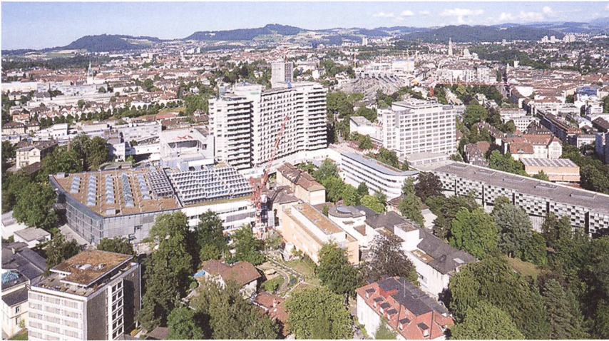
Resultat eines un- gemein raschen und teilweise chaotischen Wachstums: das Inselhospital heute.

in der Anlage des Klinikareals keine Logik mehr erkennbar ist. Darüber hinaus stösst der Betrieb heute logistisch an seine Grenzen. 2010 wurde darum ein Wettbewerb durchgeführt für einen Masterplan, der die Weiterentwicklungen, namentlich eine Verdoppelung der Nutzfläche, in den nächsten 60 Jahren regulieren soll. Sieger des Wettbewerbs wurde das Münchner Büro Henn Architekten.