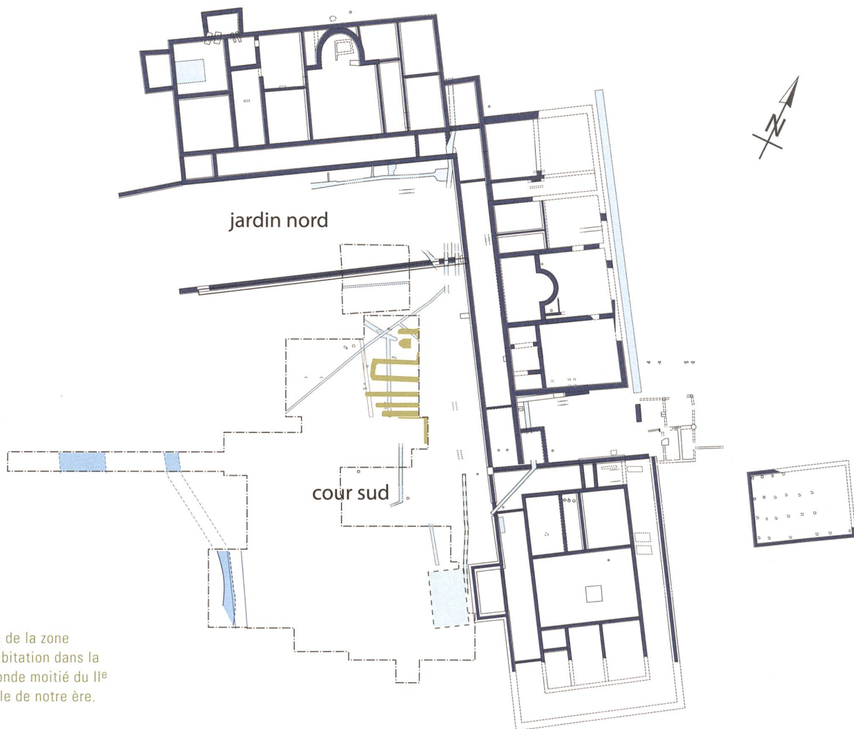
Plan de la zone d'habitation dans la seconde moitié du II e siècle de notre ère.

mosaïques, l'une dite de Bacchus et Ariane dans le bâtiment central, l'autre de la Venatio dans une salle d'apparat du bâtiment nord à l'époque sévérienne.