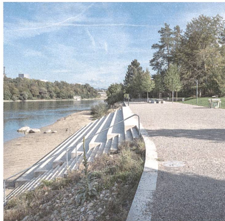
Die Freiräume gehören zu den spezifischen Qualitäten Rheinfeldens: die Rheinuferpromenade im Stadtpark West.

Die Gestaltungspläne setzen der Bauherrschaft klare Rahmenbedingungen bezüglich Städtebau, Nutzung und Vernetzung. Damit wird Qualität sichergestellt, Rechtssicherheit hergestellt und eine rasche Umsetzung von Bauprojekten ermöglicht. Der historische Stadtkern wird durch ein separates Reglement geschützt und gepflegt. Ebenso sind die wichtigsten baukulturellen Werte ausserhalb der Altstadt in Inventaren erfasst und unter Schutz gestellt. Komplexe Bauprojekte oder Eingriffe in städtebaulich sensiblen Gebieten werden konsequent