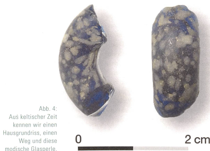
Abb. 4: Aus keltischer Zeit kennen wir einen Hausgrundriss, einen Weg und diese modische Glasperle.

Mit dieser letzten grossen Grabung fanden die archäologischen Untersuchungen im Zusammenhang mit der Erneuerung des Dorfkerns ihren vorläufigen Abschluss. Seither begleitete der ADB vor allem kleine Um- und Anbauprojekte. In anderen Dör- fern aber setzen die verdichtenden Mass- nahmen gerade erst ein – und ziehen weitere umfangreiche Grabungen nach sich.