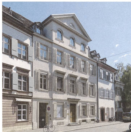
St. Alban-Vorstadt 19, Haus zur Fortuna, Achilles Huber 1810.

Eine «Vorstadt» innerhalb der spätmittelalterlichen Stadtbefestigung – schon der Name der Strasse macht einen stutzig; er stammt aus der Zeit, als sie noch vor der im 11. Jahrhundert ummauerten Kernstadt lag und sich entlang der ursprünglich keltisch-römischen Ausfallstrasse vor dem Tor des ersten Mauerrings als Vorstadt bildete. Erst mit der grosszügig bemessenen neuen Mauer aus der Zeit nach dem Erdbeben von 1356 wurden auch die Vorstädte von der Stadtbefestigung um-