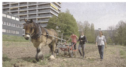
Les Jardins du Petit-Saconnex.

Une excursion de fin de semaine vous conduira dans les deux plus grandes villes de Suisse romande, pour vous faire découvrir des lieux de détente au sein de l'espace urbain. Le parcours commencera le samedi matin à Genève, où l'on pourra visiter les jardins et les cours intérieures d'hôtels particuliers du XVII e siècle. Ceux qui préfèrent les jardins de campagne et la nature aux maisons de maîtres devraient absolument se rendre au Petit-Saconnex: ils y trouveront une ferme horticole et nombre de petits jardins privés. L'après-midi sera consacré à des «oasis» d'un autre genre: les places publiques peuvent devenir des lieux de détente pour les habitants des environs, lorsqu'elles invitent les piétons à la flânerie. C'est dans ce but qu'au centre de Genève trois d'entre elles viennent d'être réaménagées. Les architectes responsables de ces réalisations