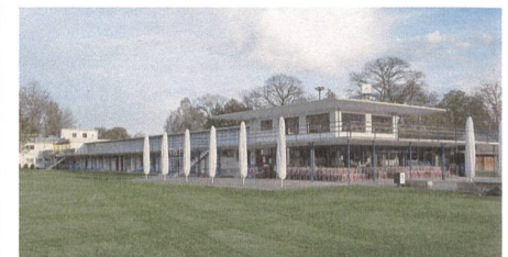
Strandbad und Stadion Lachen, Thun.

Im Schatten der Alpen finden sich städtische und ländliche Oasen sondergleichen. So bietet der Samstag architektonische Entdeckungen, der Sonntag führt mit Spaziergängen und Wanderungen ins Grüne. Am Thunersee ist der Schadaupark mit seinem herrschaftlichen Schloss für Einheimische und Touristen gleichermaßen ein beliebter Rückzugsort. Auf einer Führung wird Ihnen die Architektur von Schloss und Park durch Experten näher gebracht.