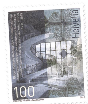
Die Sonderbriefmarke zum EKD-Jubiläum.

Mehr und mehr geraten Bauten im Spannungsfeld von Wirtschaftlichkeit, Verdichtung und energetischer Ertüchtigung unter Druck – in der Regel nicht die unbestrittenen Werke der Baukunst oder offensichtliche Denkmäler und Zeugen der Geschichte. Betroffenen sind häufig die weniger spektakulären Baudenkmäler – unbesehen davon, ob sie aus dem ausgehenden Mittelalter oder der Nachkriegszeit stammen; nicht selten sind es Wohn- und Nutzbauten. Dennoch oder gerade deshalb sind sie mit ganz besonderen Denkmalwerten Teil unseres gebauten Erbes, das unser Lebensumfeld prägt.