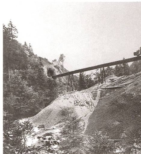
Abb. 5: Güterzug der Vitznau-Rigi-Bahn auf der berühmten Schnurtobelbrücke, fotografiert im Eröffnungsjahr der Bahn 1871.

Hochgebirge, entstanden etliche neue Berg-hotels als Basislager für die Eroberung der nahe gelegenen Berggipfel, von denen sie oftmals ihren Namen erhielten, wie das oben genannte Hotel Jungfrau am Eggishorn. Ihr Erscheinungsbild unterschied sich nun bereits von den einfachen Vorgängerbauten. Vielerorts bildeten sie einen markanten Gegensatz zu den traditionellen Holzbauten der alpinen Dörfer (Abb. 4). Die damalige Bergbegeisterung weckte auch Projekte zur Erschliessung von Gipfeln mit der Eisenbahn. Dieser Traum verwirklichte sich mit der Erfindung des Zahnradsystems, mit dem Niklaus Riggenbach (1817–1899) die erste europäische Zahnradbahn von Vitznau (LU) nach Rigi Staffel erbaute und 1871 eröffnete (Abb. 5).