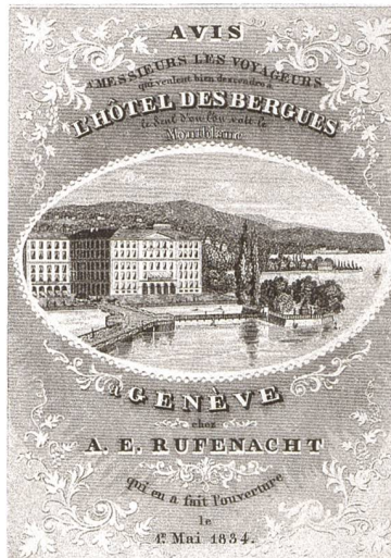
Abb. 3: Genf, Hôtel des Bergues. Das erste Stadthotel am Wasser in der Schweiz wurde 1834 eröffnet. Hotel- prospekt kurz nach der Eröffnung.

Die Geschichte der Berghotels beginnt mit bescheidenen Unterkünften in Pfarrhäusern, weist vor genau 200 Jahren ein erstes Berggasthaus auf Rigi Kulm aus, findet in den «Goldenen Jahren des Alpinismus» einen Höhepunkt mit zahlreichen Unterkünften als Basislager zur Eroberung der Drei- und Viertausender und gipfelt schliesslich in der «Belle Époque» zwischen 1880 und dem Ersten Weltkrieg mit prunkvollen Hotelpalästen.