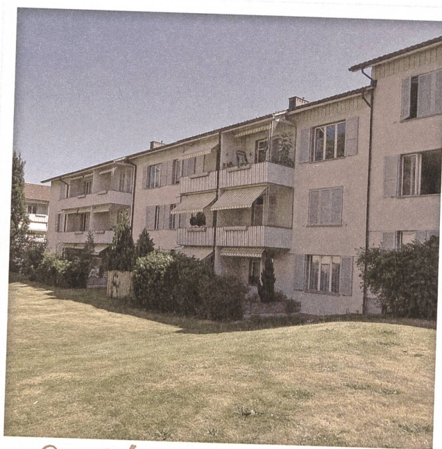
Der Grünraum der Siedlung umfließt die Gebäude auf selbstverständliche Art.

Die EKD feierte 2015 ihr hundertjähriges Bestehen. Mit ihrer Ernennung setzte der Bundesrat 1915 ein zukunftsweisendes Zeichen für die Erhaltung und Pflege des baulichen und archäologischen Erbes der Schweiz. Am 4. März wurde das Jubiläumsjahr im Martinsberg in Baden mit einem Festanlass mit Reden von Isabelle Chassot, Direktorin des BAK, Peter Hasler, Verwaltungsratspräsident der Schweizerischen Post, und Nott Caviezel, Präsident der EKD, eröffnet. Es wurden eine Sonderbriefmarke der Schweizerischen Post