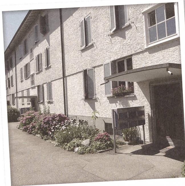
Schlichte Fassaden prägen die Siedlung.

Im August ist der Jahresbericht 2015 der Eidgenössischen Kommission für Denkmalpflege (EKD) erschienen. Er kann von der Website der Kommission heruntergeladen werden. Zwei Beispiele daraus sollen hier näher betrachtet werden. Sie betreffen die Bereiche Gutachten und Stellungnahmen sowie das 100-Jahr-Jubiläum der EKD. Sie zeigen exemplarisch die Aufgabenbreite der EKD und wie mit den Herausforderungen umgegangen wird. Mit ihnen ist auch die Denkmalpflege allgemein konfrontiert.