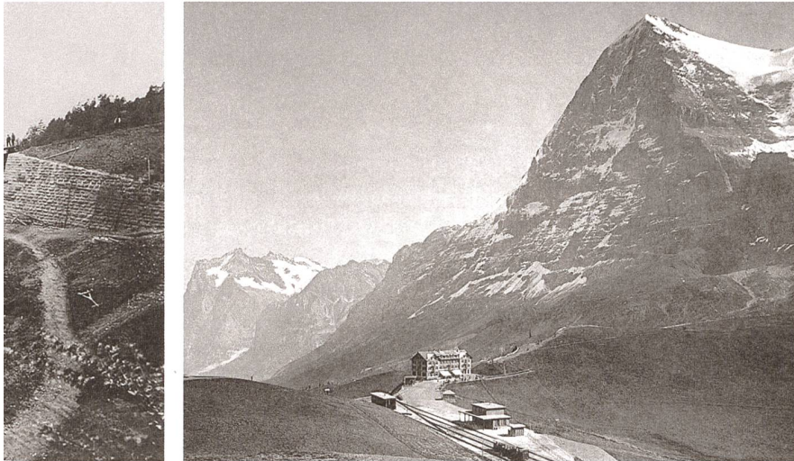
Abb. 6: Kleine Scheidegg (BE), Hotel Bellevue. Foto- grafie von 1893 mit dem gleichzeitig mit der Wengernalpbahn eröffneten Hotel.