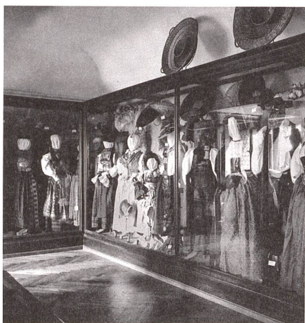
Vitrine Kostüm- abteilung, Eckturm Westflügel, Raum 60, Schweizerisches Landesmuseum Zürich, um 1900.

fessionalisierten Kunstmarkt konnten sich die Museumsleute nicht mehr auf blossе Zusicherungen persönlich bekannter Händler verlassen, um sicherzugehen, dass ihre Erwerbungen den Sammlungsidealē der «Echtheit» und «Ursprünglichkeit» entsprechen. Weit gewichtigere Hilfe erwarteten sie von Naturwissenschaften und technischen Entwicklungen wie Röntgen- und UV-Strahlen oder mikrochemischen Analysen. In den späten 1930er-Jahren zeichnete sich laut Joss eine neue Expertise ab: hin zum forschenden Blick des Naturwissenschaftlers ins Innere des Objekts.