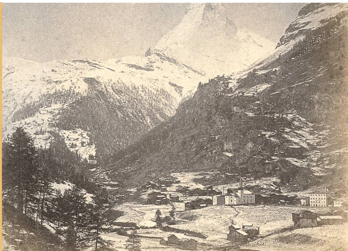
Abb. 4: Zermatt (VS), Hotel Monte Rosa. Das seit 1855 durch Alexander Seiler zum Steinbau umgebaute Hotel Monte Rosa in Zermatt stach als Massivbau deutlich aus dem traditionellen Ortsbild hervor. Älteste bekannte Fotografie um 1860 mit dem Hotel rechts im Bild.