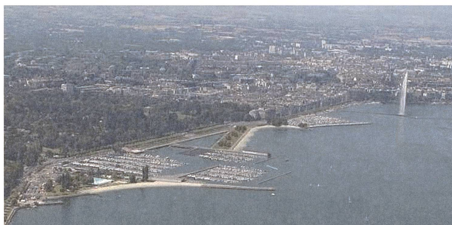
Fig. 4: Vue du futur aménagement du port-plage des Eaux-Vives.