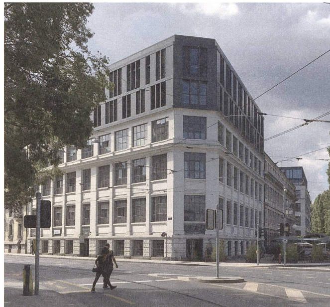
Fig. 3: Surélévation sur l'ancienne Manufacture Beyeler, bâtiment in- scrit à l'inventaire, rue des Deux Ponts 2.

sujet d'importance. À la fin du XIX ème siècle sont apparus à quelques lieues de la ville des ensembles de villas qui ont pour la plupart perduré jusqu'à présent. Une stylistique spécifique s'est développée par endroit sous l'impulsion de certains constructeurs ou architectes, notamment dans la suite de l'exposition nationale de 1896 sur le thème du village suisse. Les chalets des Frères Spring ou les maisons de l'architecte Puthon sont autant d'exemples intéressants de modèles de villa de la classe moyenne au tournant du siècle. L'arborisation de leurs parcs a façonné visuellement cette ceinture urbaine verte si caractéristique de Genève et que traversent les grands axes vers le canton et la frontière. Une densification intense est en cours sous l'impulsion de l'État et de la Ville, par des opérations concertées de PLQ