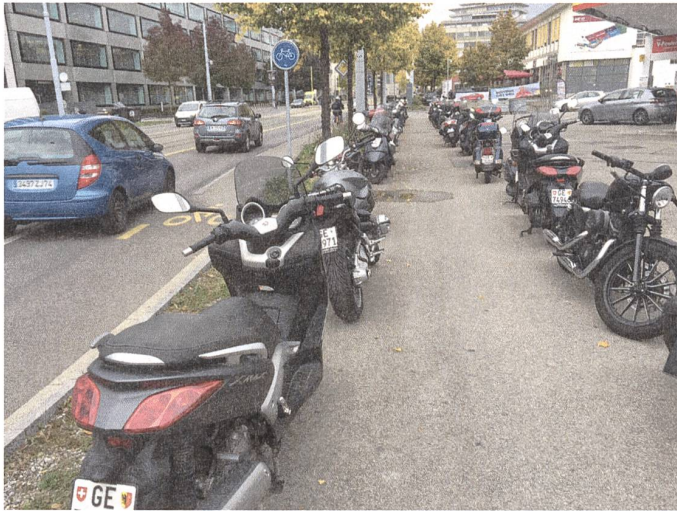
▲ Fig. 5: Une mobilité très complexe risque d'asphyxier la ville.