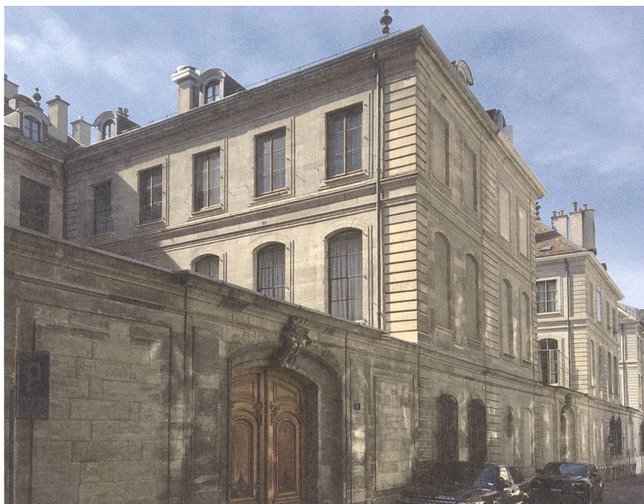
Fig. 1: Immeubles de la rue des Granges 10-1.

Cette croissance très structurée est la base de la ville contemporaine qui durant le XX ème siècle s'est ensuite développée tous azimuts principalement par un urbanisme de barres, dans la suite des plans prévus par Maurice Braillard.