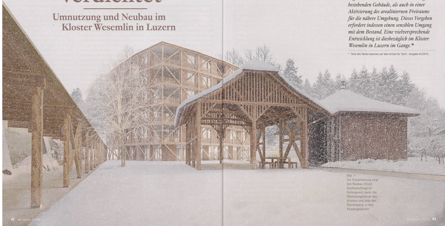
Abb. 1: Die Visualisierung zeigt den Neubau (Stand Studienauftrag) im Hintergrund, davor die Okenmieggebäude des Klosters und links den Wandelgang zu den Klostergebäuden.

* Teile des Textes basieren auf dem Artikel für Tec21, Ausgabe 41/2015.