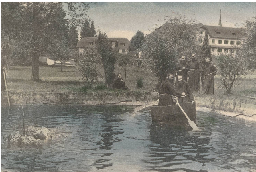
Abb. 2: Die Kapuziner am Feuerwehrteich der Klosters, 1920er-Jahre: Noch bis ins 20. Jahrhundert war das Kapuzinerkloster die Heimat einer grösseren Bruderschaft. Die Zusammensetzung der Nutzer hat sich inzwischen geändert.

Ergänzend zur Verdichtung im Altbau soll auch der Freiraum besser aktiviert werden. Dazu gehören die Neugestaltung des Klostergartens sowie ein Neubau für Wohnungen, dessen Mieteinnahmen den Unterhalt des Klosters mitfinanzieren sollen (Abb. 3). Während der Garten geöffnet wird und damit dem Quartier zukünftig als wertvoller Freiraum zur Verfügung steht, bringt das neue Gebäude zusätzliche Bewohner auf das Areal. Ausgehend von einer Machbarkeitsstudie