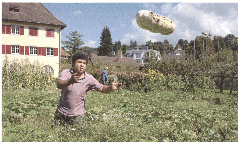
Abb. 4: Im Klostergarten findet ebenfalls eine Verdichtung statt: Flüchtlinge haben mit der Pflege des Gartens eine Beschäftigung gefunden (im Rahmen eines Beschäftigungsprogramms des SAH Zentralschweiz). Im Hintergrund rechts ist das Baugespann für den Neubau zu sehen.

des Gartens mitgestalten und andererseits wirken Flüchtlinge im Zuge eines Beschäftigungsprogramms bei der Bewirtschaftung mit (Abb. 4). Dies zeigt schon jetzt, welches Potenzial im Klostergarten als Raum sozialer Interaktion steckt. Inwiefern diese Interaktion auch auf den geplanten Neubau übergreifen kann, wird sich zeigen. Seine isolierte Lage, der eigene Zugang durch die Klostermauer und die umgebenden Bäume unterstützen dies eher nicht. Daran ändert auch der Wandelgang entlang der Mauer, als Verbindung zum Kloster, nur wenig. Bleibt zu hoffen, dass die neuen Mieter der dreissig 2½- und 3½-Zimmer Wohnungen sowie der 200 Quadratmeter gewerblicher Nutzungen den Austausch suchen und der Neubau dadurch zum integralen Bestandteil der Klosteranlage wird. Denn das Konzept «Oase-W» hat eindeutig das Potenzial, dem Kloster eine neue Identität zu geben, die in der Geschichte des Ortes und seiner bisherigen Bewohner verwurzelt ist.