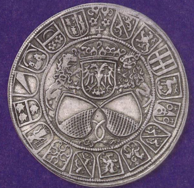
Die Wappenpyramide mit den zwei Löwen auf einem Taler der Stadt Zürich (1512) lässt sich direkt auf die Wappenscheibe des Lux Zeiner für den Tagsatzungssaal von Baden AG (Abb. S. 22) zurückführen.