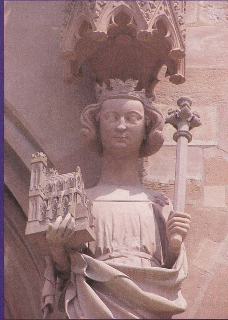
Der heilige Kaiser Heinrich II. mit Kirchenmodell und Lilienzepter an der Westfassade des Basler Münsters (um 1280).