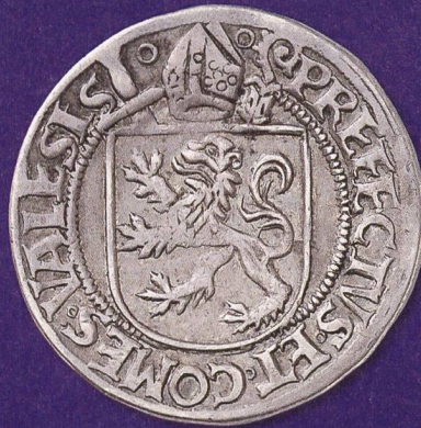
Repräsentation durch Wappen: Das Bischofswappen des Bistums Sitten auf einem Teston um 1480/85 (Jodokus von Silenen, 1482–1496).