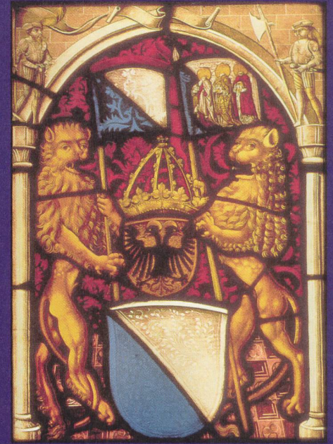
Wappenpyramide mit zwei Löwen auf der Wappenscheibe des Zürcher Glasmalers Lux Zeiner (um 1501).

hen Prestigewert hatte. Karl der Grosse war auch bildlich seit dem späteren 13. Jahrhundert mit einer Statue am Südturm der Kirche präsent.