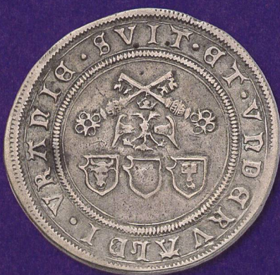
Eine Variation der Wappenpyramide auf einem Guldiner (1506/08) der Waldstätte Uri, Schwyz und Nidwalden: Die Petruschlüssel des Papsttums sind höherrangig als der Doppeladler des Reichs.