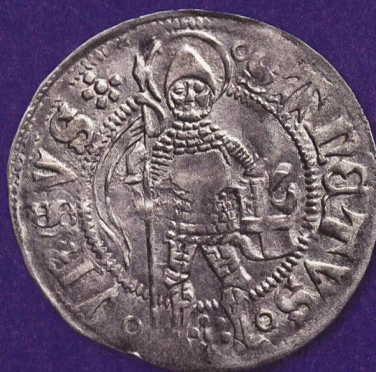
Identifikation mittels des Landespatrons: Der Heilige Ursus als Ganzfigur auf einem Plappart der Stadt Solothurn (um 1470).