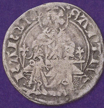
Nachahmung I: Auf der Rückseite des Plapparts der Stadt Zürich (1417/18) ist in ähnlicher Weise Karl der Grosse mit Schwert abgebildet.