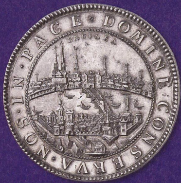
Stadtansicht als Chiffre der Stadtrepublik: Basel von Norden gesehen auf einem Doppeltaler (nach 1700).