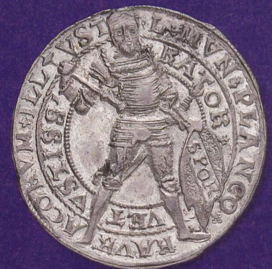
Ein «humanistischer Heiliger» für die Stadt Basel: L. Munatius Plancus, der Gründer von Augusta Raurica, auf der Rückseite eines Basler Halbtalers von 1542.