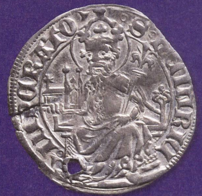
Nachahmung II: Schilling der Stadt Basel (1425/26) mit der Darstellung des heiligen Kaisers Heinrichs II. mit Kirchenmodell und Lilienzepter auf der Rückseite.