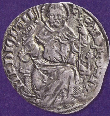
Das Vorbild: Die Rückseite eines Grosso des Herzogtums Mailand (Gian Galeazzo Visconti, ab 1395) trägt den Heiligen Ambrosius auf einem Thron mit Geißel und Bischofsstab.