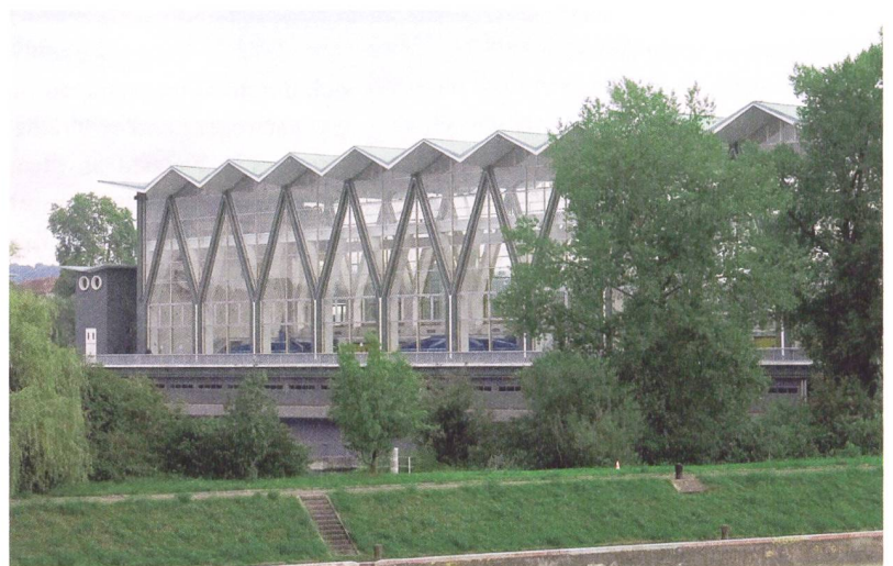
Kraftwerk Birsfelden, 1955 von Hans Hofmann.

Die drei Jahrzehnte Nachkriegsarchitektur – in der Schweiz und anderswo – lassen