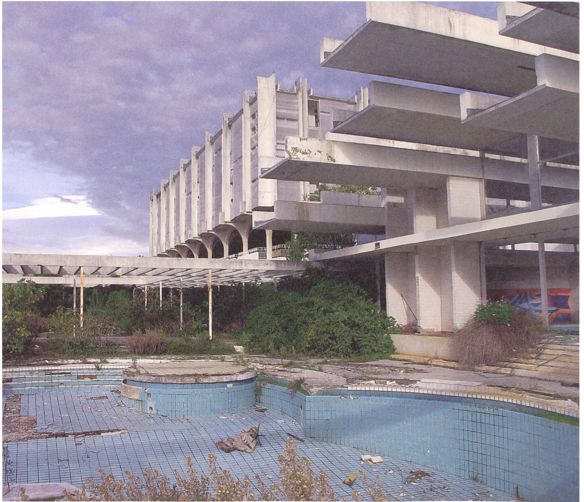
Haludovo Palace Hotel in Malinska/Krk, 1969–1972 von Boris Magaš; seit 2002 geschlossen und verwahrlost.

sich durchaus im positiven Sinn am besten als heterogen und vielfältig bezeichnen. Gerade die Vielzahl an theoretischen Ansätzen und stilistischen Ausprägungen, aber auch die Ausweitung des Berufsbildes des Architekten erschwert die Festlegung von Bewertungskriterien. Neben führenden Architekten, die mit ihren Schöpfungen aus heutiger Sicht Meisterwerke hinterliessen, deren Wert kaum bestritten wird und in der Regel – denkmalgeschützt oder nicht – auch entsprechend sorgsam behandelt werden, darf man den weniger bekannten und in weit grösserer Zahl vorhandenen Bestand nicht vergessen. Dieser Bestand, der eben nicht nur aus Leuchttürmen besteht, sondern in der Summe dessen, was ihn ausmacht, das charakteristische Lebensumfeld der Nachkriegsjahre prägt, darf nicht einfach zur quantité négligeable erklärt werden. Unter dem Gesichtspunkt der Nachhaltigkeit und dem Aspekt, nicht nur einzelne Meisterwer-