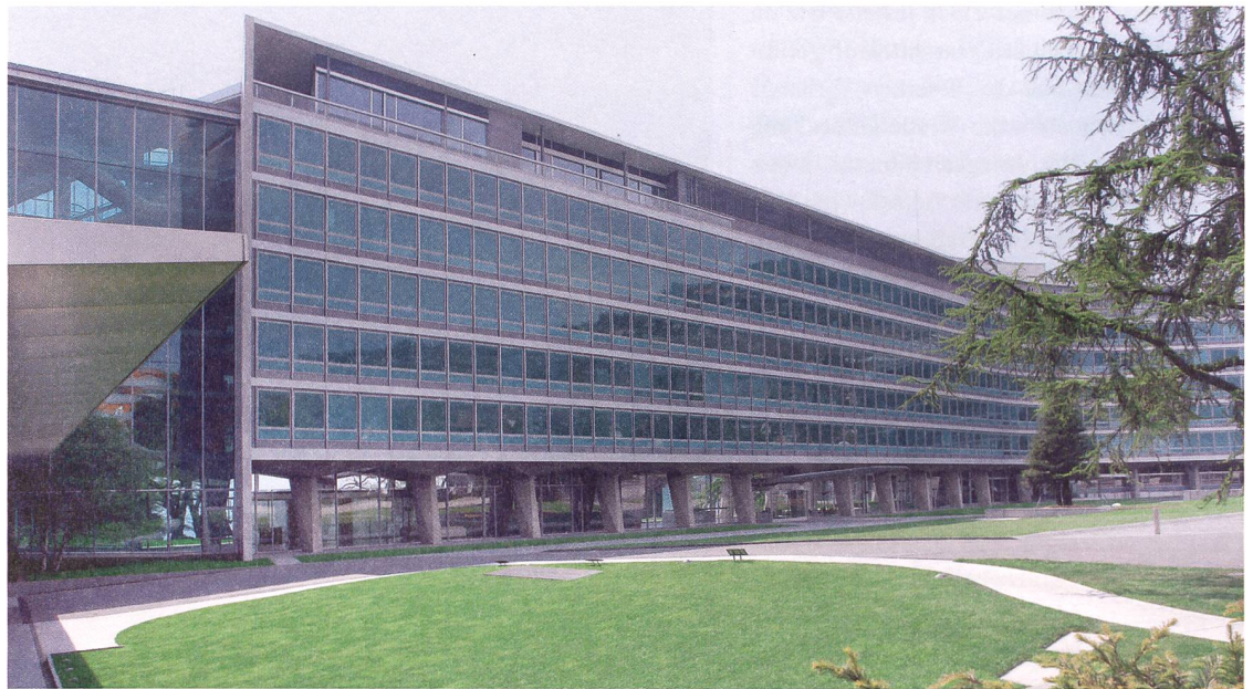
Nestlé-Firmensitz in Vevey, 1957–1960 von Jean Tschumi.

der für unser Land sprichwörtlich hohen Qualität des Handwerks standen. Diese Umstände machten die Schweiz nicht besser, aber privilegierter. Die Verunglimpfung der Nachkriegsarchitektur, sie sei schlecht gebaut, trifft pauschal für die Schweiz jedenfalls nicht zu. Im Gegenteil. Unter der Voraussetzung, dass die Gebäude instand gehalten wurden, ist dieser Bestand nach 40, 50 und 60 Jahren in der Regel in einem erstaunlich guten Zustand. Mit inspirierten und angemessenen Massnahmen lässt sich dieser Gebäudepark auch energetisch auf einen neuen Stand bringen, dessen genuine Nachhaltigkeit dadurch gesamthaft kostengünstig um weitere Jahrzehnte verlängert werden – Grund genug, zu diesem Bestand Sorge zu tragen.