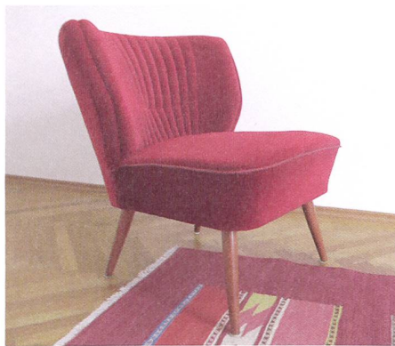
Typischer Cocktailsessel aus den Fünfzigerjahren.

Als integrierendes und sozial nachhaltiges Projekt war es geplant worden, das neue, 1955 vom amerikanischen Architekten Minoru Yamasaki (1912–1986) in der Stadt St. Louis / Missouri errichtete Wohnquartier Pruitt-Igoe (Abb. S. 15). Doch der Niedergang der Siedlung begann schon in den frühen 1960er-Jahren. Die Lebensverhältnisse hatten sich schnell verschlechtert und die Siedlung verwaahlte zusehends, 1971 standen von 31 Blöcken 16 leer. Am 15. Juli 1972 wurde die Grosssiedlung nach nur 18 Jahren ihres Bestehens schliesslich gesprengt und abgerissen. An diesem Ereignis machte der amerikanische Architekt und Architekturtheoretiker Charles Jencks (*1939) das Ende der Modernen Architektur fest, das gleichzeitig auch für das Versagen eines vielversprechenden sozialen Projekts und städtebaulichen Konzepts stand. 1 Jencks verstand «the day Modern Architecture died» gleichsam als Manifest eines abrupten Endes. In Fachkreisen hat sich eingebürgert, die «erste Ölkrise», die im Herbst 1973 der