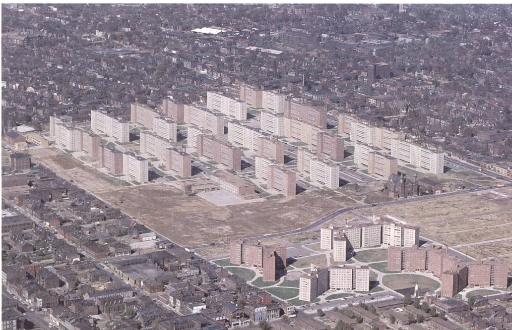
Siedlung Pruitt Igoe in St.Louis/Missouri, 1955 von Minoru Yamasaki.