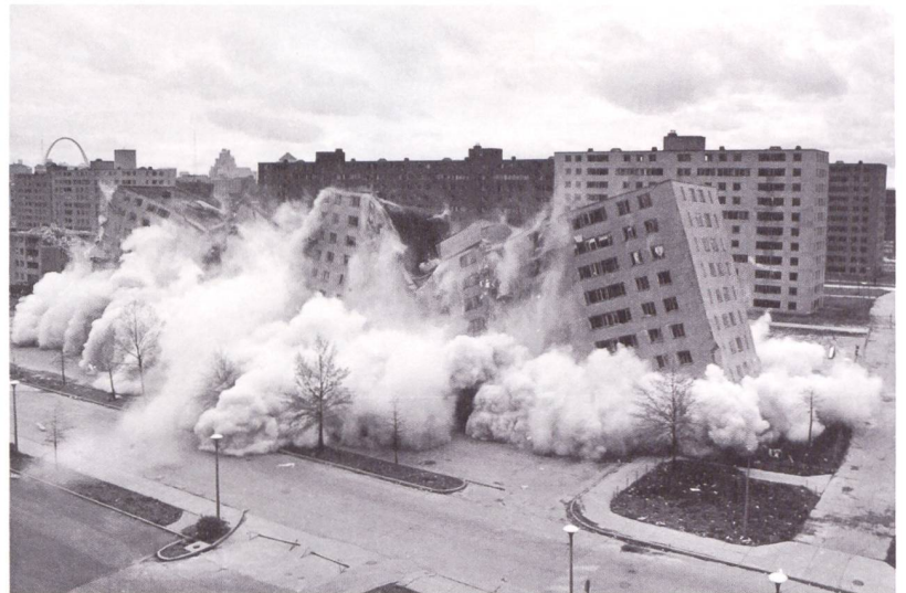
Sprengung der Siedlung Pruitt-Igoe am 15. Juli 1972.

Vielleicht, dass der schweizerische Architekturbestand aus der Nachkriegszeit im Vergleich mit der zeitgleichen Architekturproduktion in unseren Nachbarländern – mindestens in der Ersten Phase bis gegen die 60er-Jahre hin im Allgemeinen nachhaltiger, möglicherweise auch solider gebaut wurde. Nicht, weil die Schweiz über bessere Architekten verfügt hätte, aber über mehr Mittel, über hochwertigere Materialien und nicht zuletzt über mehr qualifizierte Arbeitskräfte, die in einer langen Tradition