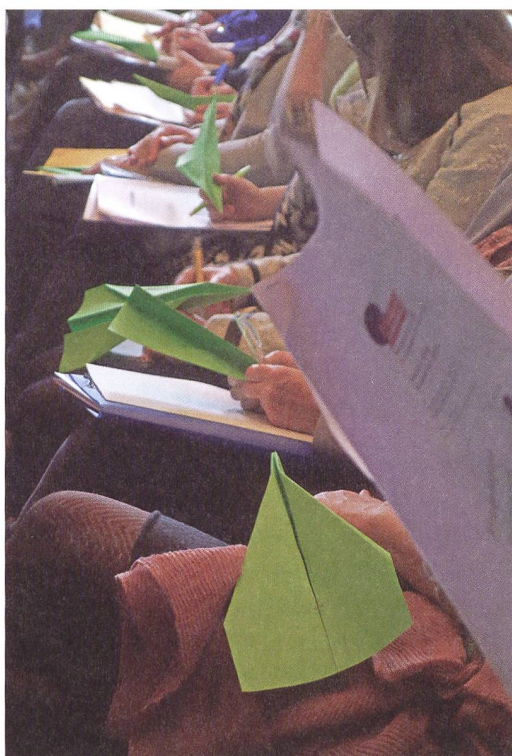
Fig. 2: L'artiste Martin Schick «Je vous présente»: un projet participatif sur scène transformant le public en collaborateurs.

lien social, le lien de la rencontre. La participation culturelle permet par exemple au public de pouvoir accéder aux œuvres présentées dans un musée d'arts en faisant confiance à sa propre perception et en tirant du savoir et du plaisir. David Vitali, chef de la section Culture et Société de l'Office fédéral de la culture (OFC), rappelait les intentions du message culturel 2016–2020, en soulignant la volonté d'offrir un accès à la culture pour tous. L'OFC souhaite d'ailleurs soutenir des projets participatifs permettant une pratique active de la part du public.