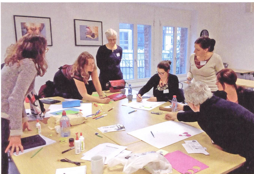
Fig. 3: Ateliers pratiques – Ebauche d'un projet participatif au Musée d'histoire naturelle de Fribourg.

compter sur des artistes, des représentants politiques, des professionnels de la communication et des collaborateurs d'institution de soutien à la culture. Cette richesse d'horizons a offert un partage de connaissances et de questionnements encore plus original qu'entre pairs. Le format participatif et immersif a été très apprécié et a permis d'explorer différemment une thématique qui mérite encore plus de journées comme celles-ci. Enfin, pour les institutions fribourgeoises accueillant des ateliers, elle a été l'occasion de profiter très concrètement d'expériences et d'idées provenant d'un réseau de professionnels sur place et d'échanger sur leurs propres questionnements.