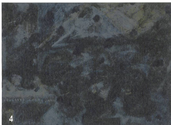
Abb. 6: Ausschnitt aus Bild Nr. 104 der Nordapsis der Klosterkirche, Multispektralaufnahmen. Von oben nach unten: Sichtbares Licht, UV Reflektanz, Infrarot Fluoreszenz, UV Fluoreszenz. Die weissen Bereiche in Bild 3 und die gelblichen Bereiche in Bild 4 deuten jeweils auf die Präsenz von Ägyptisch Blau und Mennige.