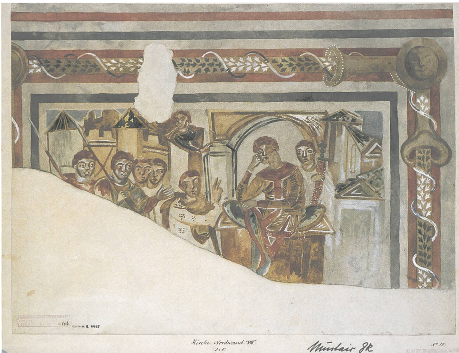
Abb. 2: Dachraum der Kirche, Bild 20: David empfängt die Nachricht vom Tode Absaloms. Aquarell von Robert Durrer.

© Eidgenössisches Archiv für Denkmalpflege, Sign. EAD-102