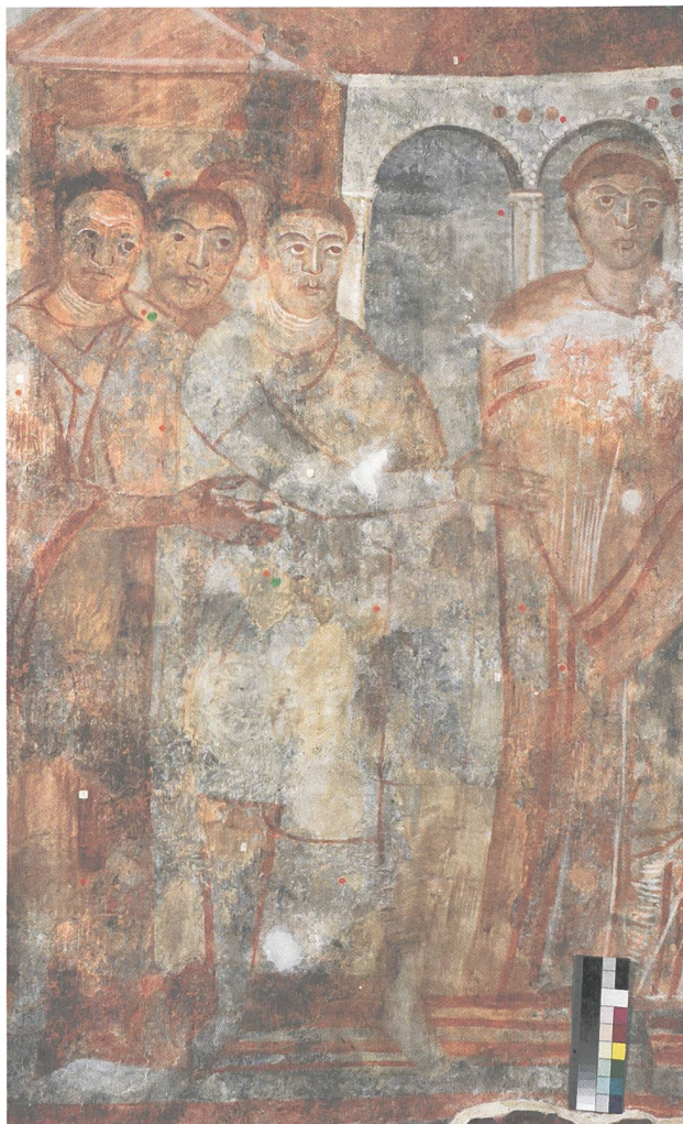
Abb. 3: Innenraum der Kirche, Südapsis, Bild Nr. 114: Ausschnitt, nach der Restaurierung 2015.