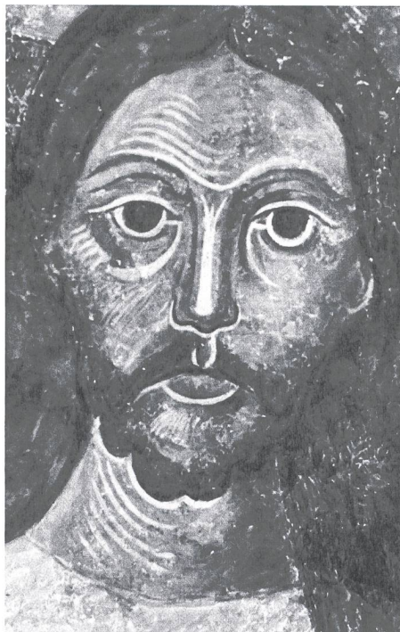
Abb. 4: Kopf Christi in der Kalotte der Mittelapsis der Klosterkirche vor und nach der Anbringung der Übermalungen durch Franz Xaver Sauter in den Jahren 1947–1951.

Ein Schwerpunkt der laufenden, paral- lel zu den Konservierungs- und Restaura- rungsarbeiten durchgeführten Untersuchun- gen liegt auf der Farbigkeit der Fresken. Heute erscheinen sie fast monochrom mit dominierenden Rot- und Brauntönen, die durch schwarze, graue und weisse Farbtöne ergänzt werden. Dass die Polychromie der Fresken viel komplexer und vielfältiger war als mit blossem Auge an den verbliebenen Resten ersichtlich ist, stellten bereits Zemp und Schmarsow anhand der Malereien im Dachraum der Kirche fest. Ihre Beobachtun- gen wurden von späteren Kunsthistorikern wenig berücksichtigt, so dass lange Zeit die Meinung vorherrschte, dass das Überwie-