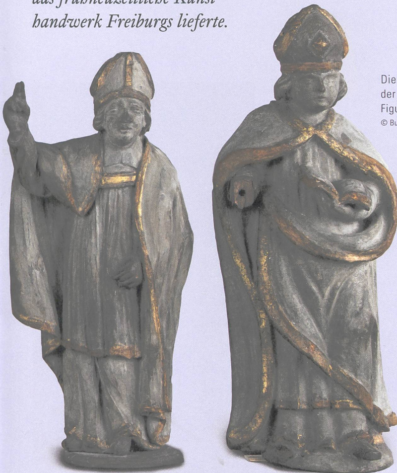
Die Kanzelskulpturen der Kathedrale Freiburg, Figuren A (links) bis F.

Betrachtet man die Rückseiten der Skulpturen, lässt sich erkennen, dass vier der sechs Skulpturen aus Holz bestehen, während die übrigen aus Sandstein gefertigt sind. Es handelt sich um die Skulpturen B und D, welche aufgrund ihrer Stilistik und Materialität schon früher als Werke des Bildhauers Hans Geiler († um 1534/35) und somit dem Originalbestand von 1516 zugewiesen wur-