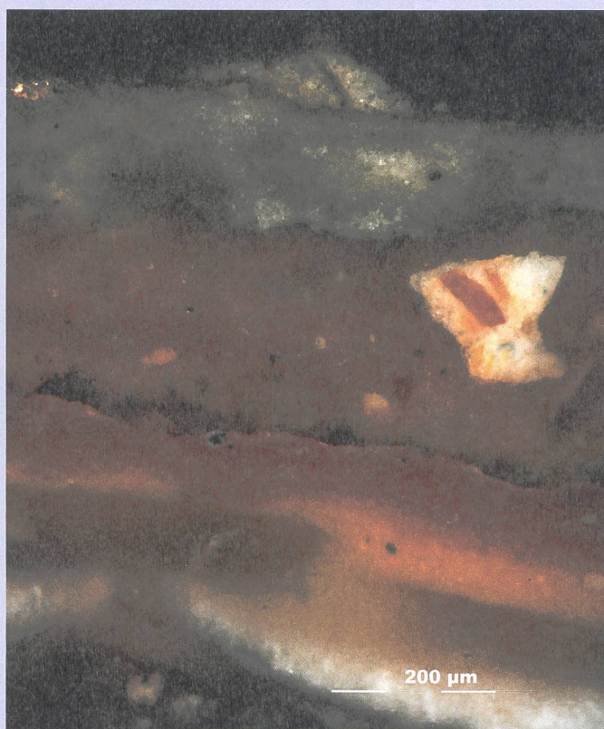
Anschliff der Probe D2 (Vergoldungen) unter 200-facher Sehfeldvergrößerung, Hellfeld, gekreuzte Polarisatoren. In der unteren Bildhälfte erkennt man die mehrschichtige Polimentvergoldung (Goldblatt horizontal in der Bildmitte). Darüber befindet sich eine Schicht grobkörnigen Poliments.