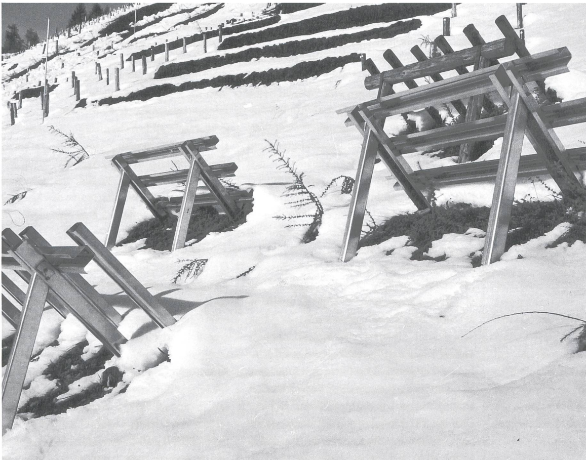
Abb. 5: Versuchsbau, der 1951 vom SLF auf dem Dorfberg (GR) erstellt wurde. Stützverbauungen sind der wichtigste bauliche Lawinenschutz in der Schweiz: Mehr als 500 km Stützwerke verhindern das Anbrechen von Lawinen und prägen so die alpine Landschaft massgeblich.