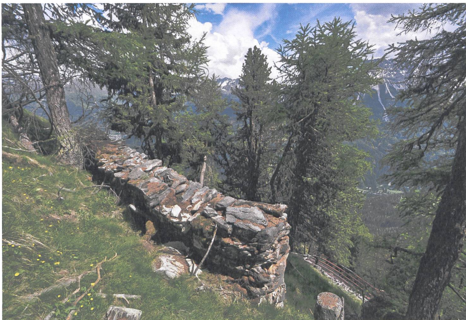
Abb. 2: Steht heute noch: die erste technische Verbauung von 1868 auf der Motta d'Alp in Martina (GR).

Sich zu schützen ist ein urmenschliches Bedürfnis. Wir schützen uns vor Regen, Wind, Hitze und Kälte. Während Länder mit Meeranstoss und flachem Gelände wie die Niederlande vor allem mit dem Wasser zu kämpfen haben, müssen sich Gebirgsländer wie die Schweiz vor allem mit gravitativen Naturgefahren wie Stein Schlag, Felssturz, Murgang – und Lawinen auseinandersetzen.