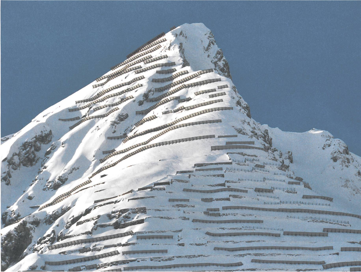
Abb. 4: Landschaftsprägend: Im Lawinanrissgebiet am Schiahorn oberhalb Davos (GR) stehen insgesamt rund 10 km Stützwerke und Mauern. Die ersten Mauern wurden 1920 aus Steinen erstellt, die neusten Stützwerke aus Stahl können eine bis zu 5 Meter hohe Schneedecke stabilisieren und diese am Anbrechen hindern.