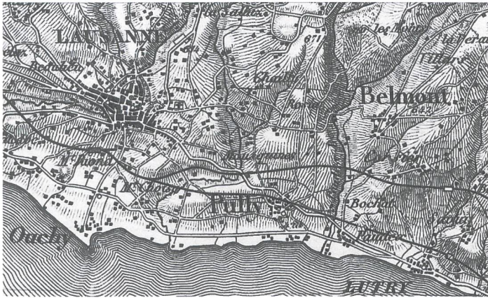
Die bauliche «Erosion» von Pully durch das exponentielle Wachstum der Gemeinde: Oben 1862 (Dufourkarte), unten 2015.