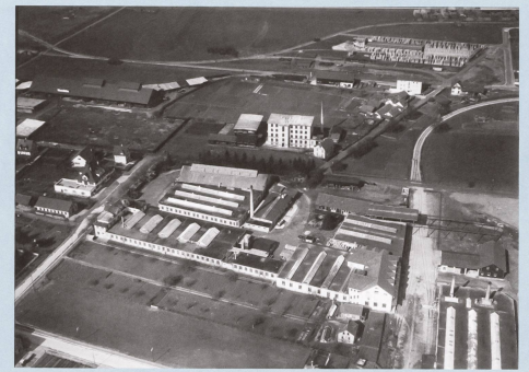
Diese Luftaufnahme war im Bildarchiv der ETH-Bibliothek mit «Albisrieden, Schächli Metallbau» beschriftet, datiert von 1933. Der freiwillige Mitarbeiter Walter Aebberli stellte fest, dass dieselbe Liegenschaft auf einer anderen Aufnahme «Motorwagenfabrik Arbenz» hiess, zeitlich nur grob eingegrenzt zwischen 1919 und 1937. Aebberli recherchierte und kam zu folgendem Korrekturvorschlag für beide Bilder: «Albisrieden bei Zürich, Motorwagenfabrik Denkers». © ETH-Bibliothek Zürich, Bildarchiv, Walter Mittelholzer, LBS_MH03-0042

Mit dem Ersten Weltkrieg und dem Entstehen von Fliegertruppen wurde die Luftbildfotografie vielerorts für die militärische Aufklärung verwendet. In der Schweiz tat