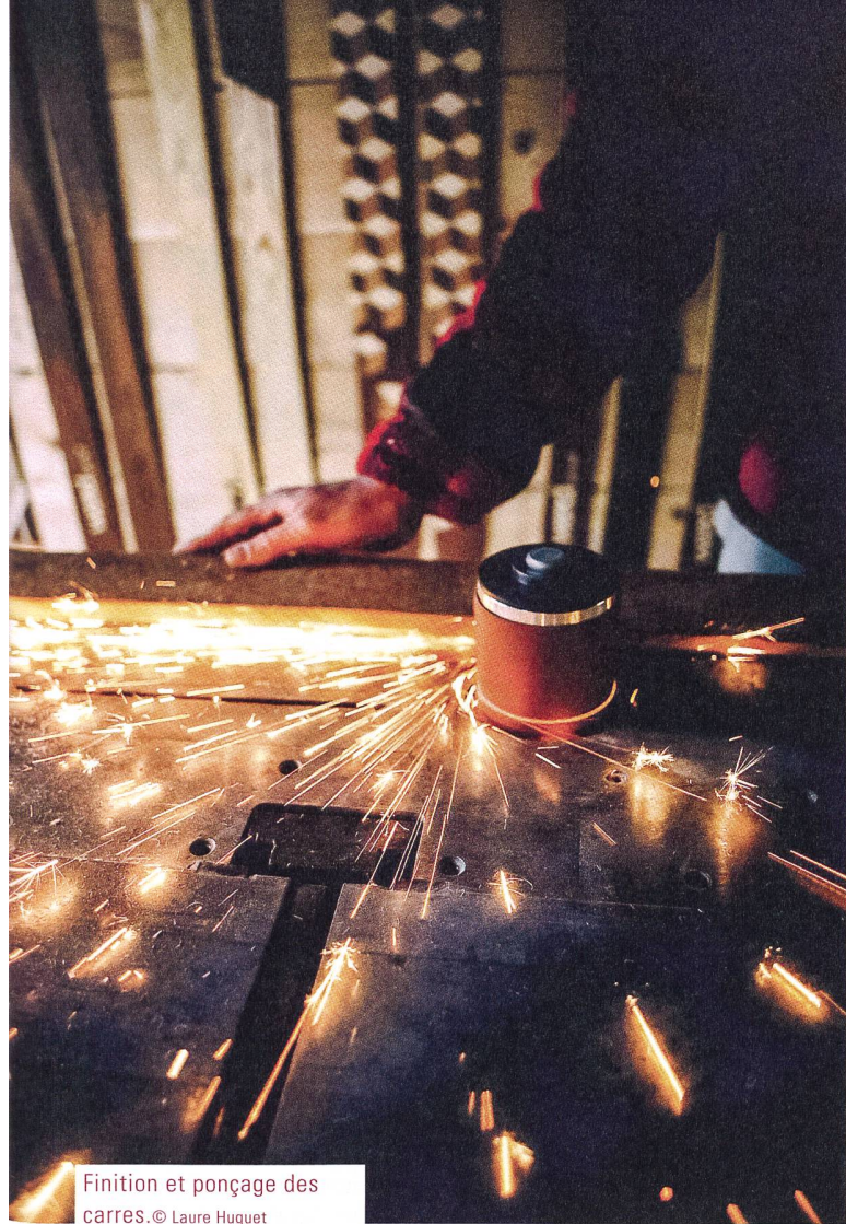
Finition et ponçage des carres.