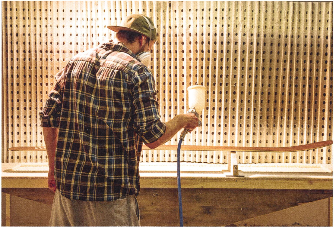
Application de la couche de finition au pistolet.