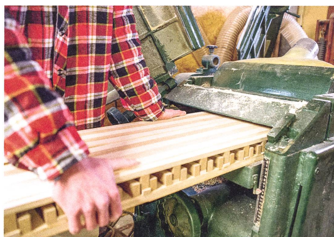
Profilage de l'épaisseur des noyaux.