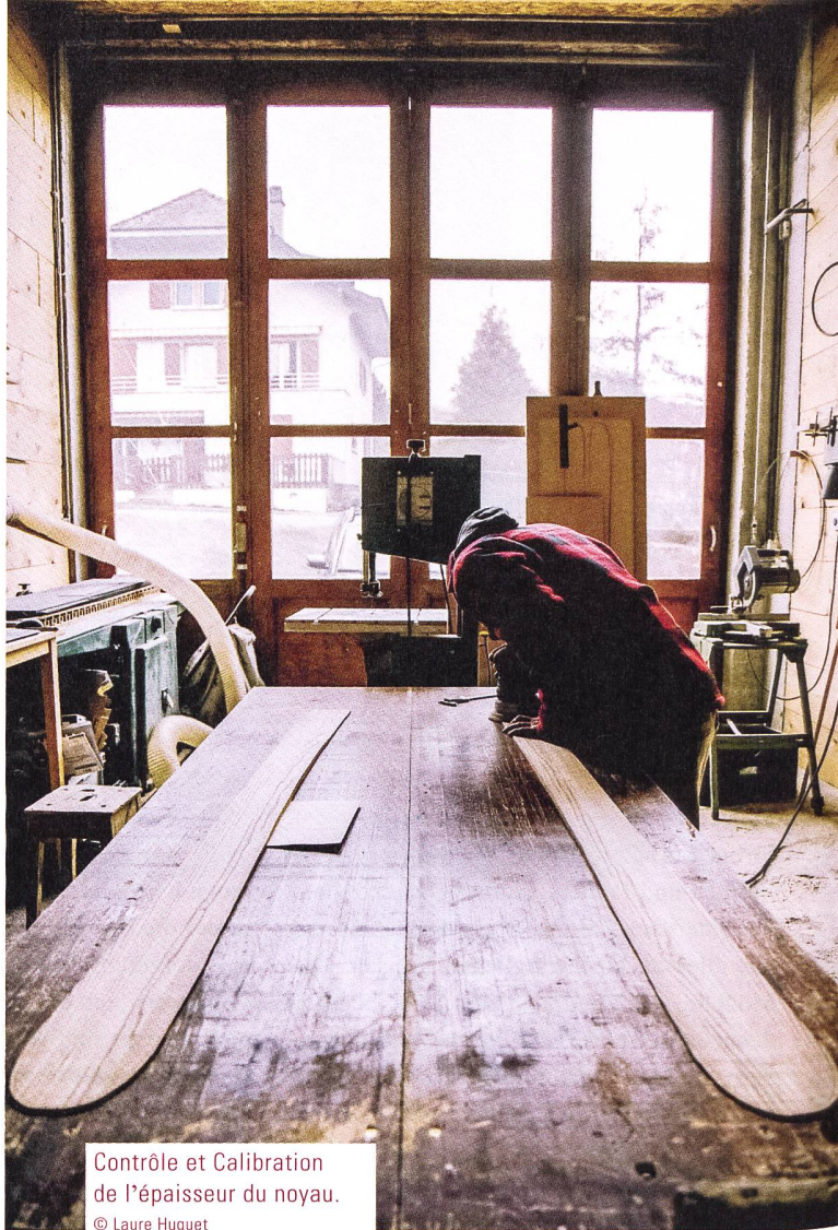
Contrôle et Calibration de l'épaisseur du noyau.