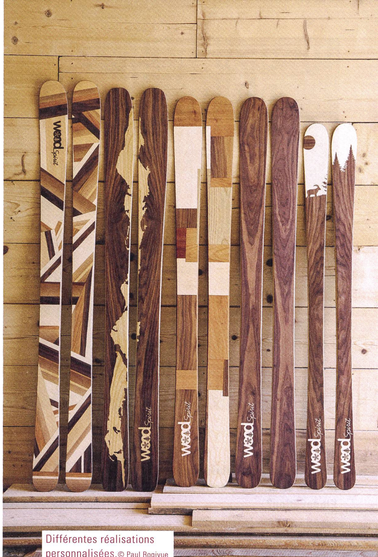
Différentes réalisations personnalisées.