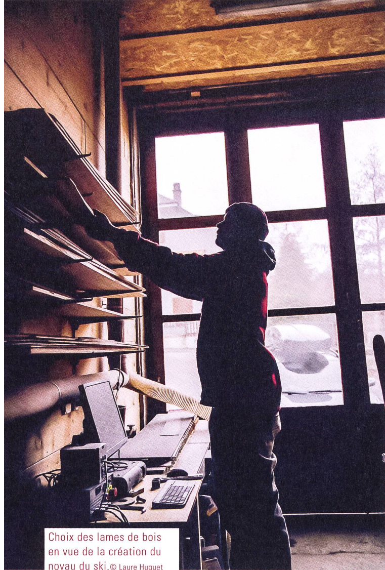
Choix des lames de bois en vue de la création du noyau du ski.