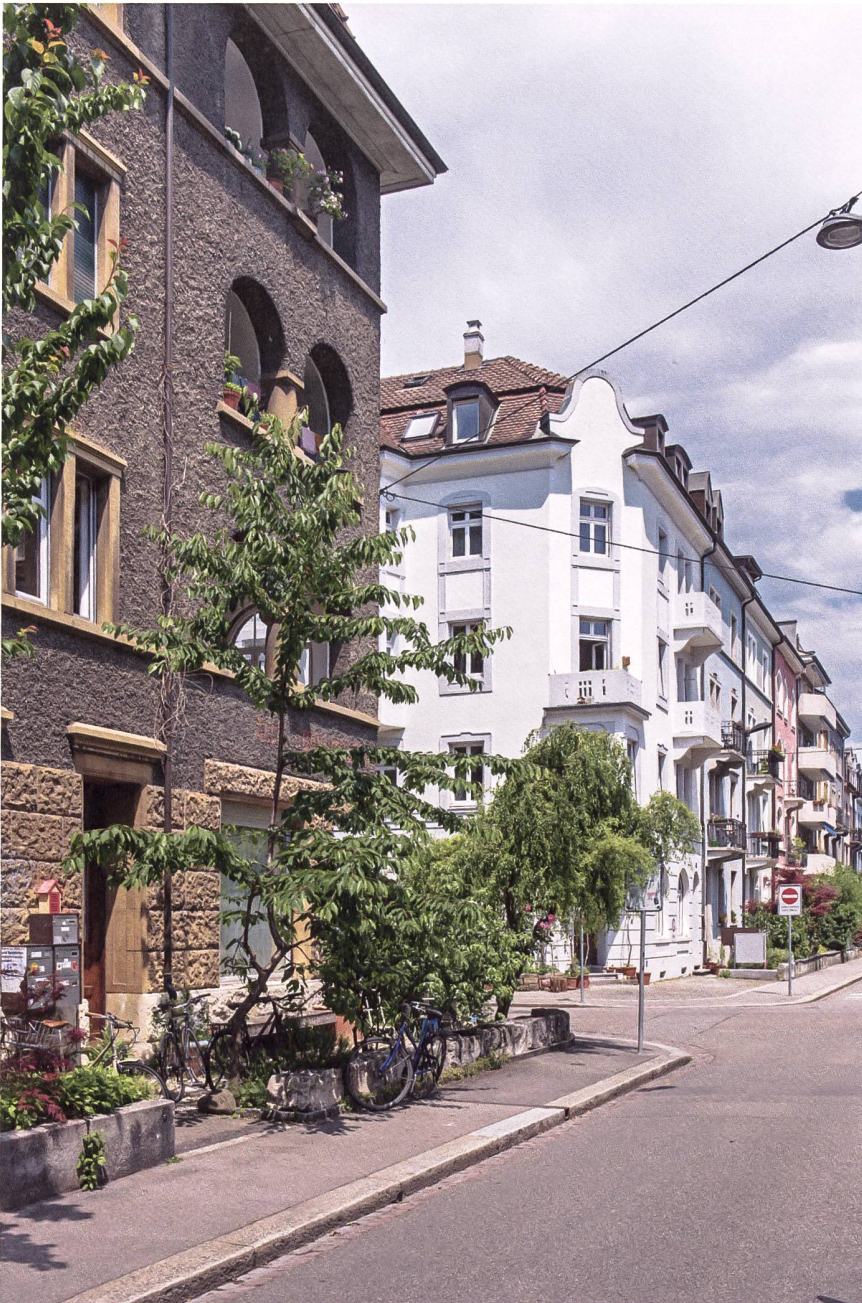
Das untere St. Johann hat noch den Charakter des Arbeiterquartiers: Hohe Wohndichte und architektonische Qualität schlossen sich um 1909–1912 nicht aus.