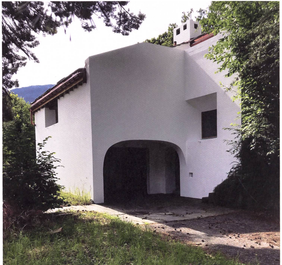
Verkauft auf der Plattform «Marché Patrimoine»: Das Haus Schorta in Tamins, erbaut 1975/76, ist ein typisches Beispiel für die Architektur von Rudolf Olgiati.

Von den 61 Baudenkmälern, die bisher auf der Plattform inseriert wurden, konnte mehr als die Hälfte bereits erfolgreich vermittelt werden. Das ist eine gute Bilanz für ein noch so junges Projekt. Es zeugt von einem grossen Interesse an der historischen Bausubstanz in der Schweiz und dem Wunsch vieler, die hiesige Baukultur aktiv zu beleben und zu erhalten. Die Plattform «Marché Patrimoine» vermittelt aber nicht nur, sie informiert die Besucherinnen und Besucher auch über aktuelle Fragen rund um Restaurierung und Denkmalpflege.