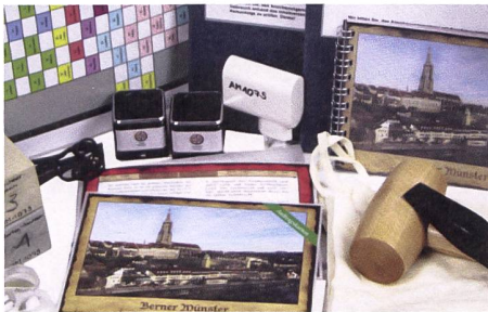
Für Schulen: Ideen zum Berner Münster. © PH Bern

Zum 600-Jahre-Jubiläum des Berner Münsters hat die Pädagogische Hochschule Bern Unterrichtsmaterialien entwickelt, die Einblick in historische, kulturelle und architektonische Besonderheiten des Sakralbaus geben – von seiner Grundsteinlegung bis heute. Damit lassen sich Exkursionen mit Schulklassen zum Berner Münster vorbereiten und durchführen. Die modular aufgebauten Aufträge können thematisch oder chronologisch sortiert werden. Dies erlaubt es den Lehrpersonen, einzelne Aspekte zu fokussieren.