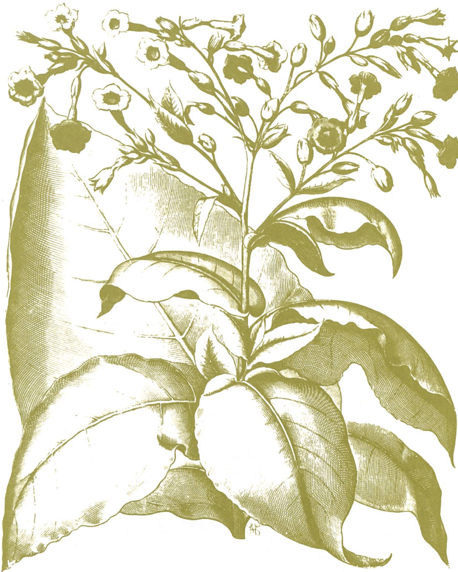
Abb. 6: Bauerntabak, Nicotiana rustica , Hortus Eystettensis, 1713. In: Mitteilungen 1/1999, S. 23.