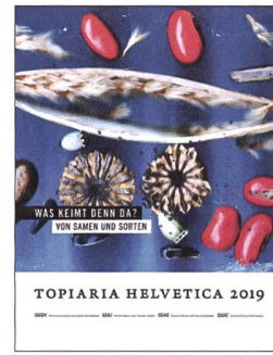
Abb. 4: Jahrbuch «Topiaria Helvetica» der Schweizerischen Gesellschaft für Gartenkultur.

-rassen nahesteht. Eine andere Aktion war – mit wandelndem Titel – die «Auszeichnung der SGGK». Mit dieser würdigte die SGGK im Zeitraum von 1985 bis 1996 die gelungene Erhaltung, Restaurierung oder Neuschaffung wertvoller Gärten oder Grünanlagen innerhalb einer typologischen Gruppe. Die Auszeichnungen sollten «die Bedeutung der Gärten als kulturelles Erbe und die Ziele der Gesellschaft besser bekannt machen. Eine heimliche didaktische Absicht zielte wohl auch darauf, einem grösseren Publikum Kenntnisse für die Beurteilung gestalterischer Qualitäten zu vermitteln [...]» 9 Thematisch sind sie eng verwandt mit dem seit 1989 vom Schweizer Heimatschutz verliehenen Schulthess-Gartenpreis.