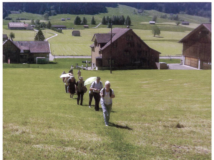
Abb. 5: Spaziergang der SGGK im Jahr 2015 zu Wetterbäumen, Trüeter, Pflanzplätzen und weiteren Eigenheiten der Appenzeller Gartenkultur, einmal mit Sonnenanstatt Regenschirm.