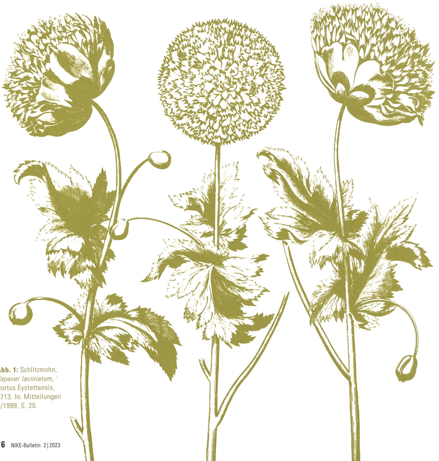
Abb. 1: Schlitzmohn, Papaver laciniatum , Hortus Eystettensis, 1713. In: Mitteilungen 1/1999, S. 20.

40 Jahre Schweizerische Gesellschaft für Gartenkultur