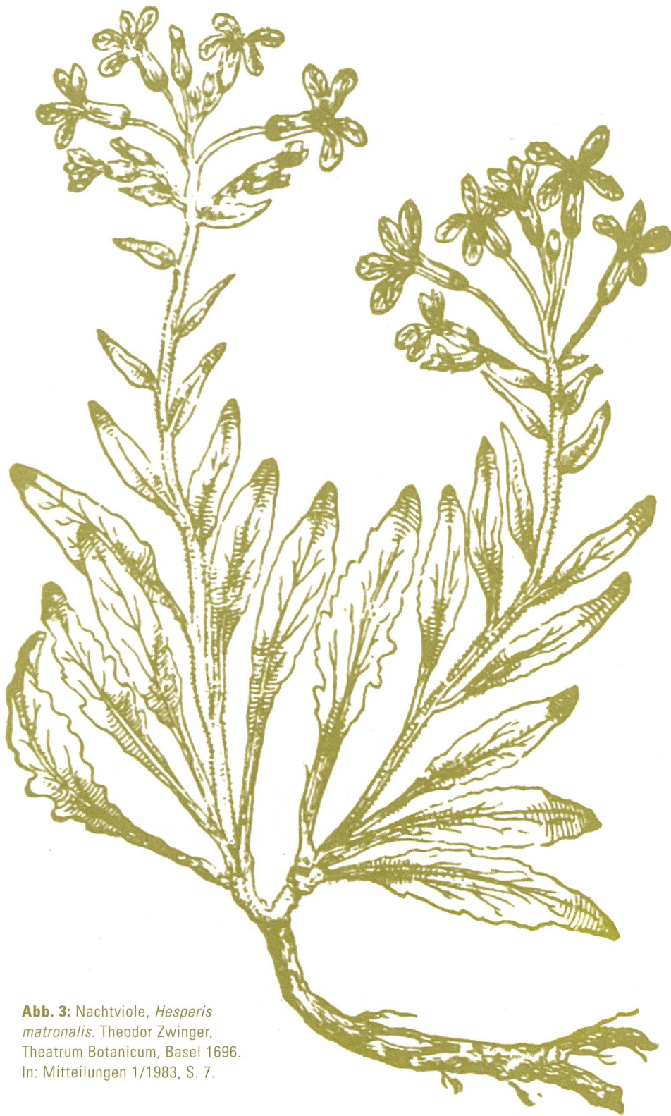
Abb. 3: Nachtviole, Hesperis matronalis . Theodor Zwinger, Theatrum Botanicum , Basel 1696. In: Mitteilungen 1/1983, S. 7.

wie viele Nachfahren der damals angesäten Nachtviolen, Zuckerwurzeln, Violettblättrigen Basiliken, Gelben Randen, des Schlitzmohns, Bauerntabaks, der Haferwurzeln und vieler mehr heute noch in den Gärten der SGGK-Mitglieder zu finden sind. Mit der Samenaktion nahm sich die SGGK bereits sehr früh und ganz praktisch «dem Problem der Rettung von aussterbenden Gartenpflanzen an» 7 , einem auch für die Gartendenkmalpflege bedeutenden Thema, denn Erscheinungsform, Duft und Farbe der Bepflanzung trägt stark zur Authentizität eines Gartens bei – und sein Charakter verändert sich, wenn diese Pflanzen nicht mehr erhältlich sind.