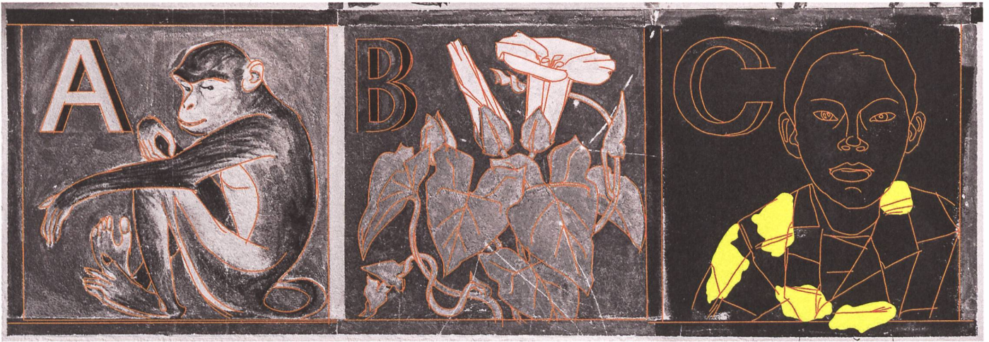
Abb. 4: Kartierung der Bildfelder A, B und C. Orange: Ritzungen. Gelb: Kittungen.