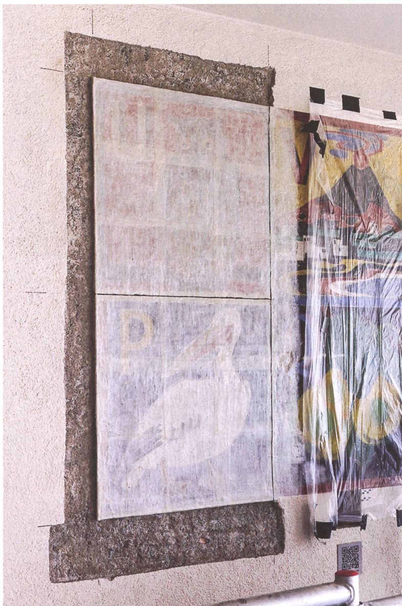
Abb. 6: Bildfelder U und P mit aufliegendem Facing und Reduzierung des umgebenden Wandverputzes fürs Anlegen der Säge.