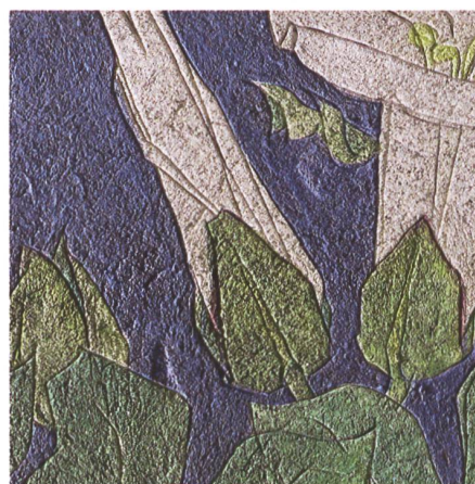
Abb. 3: Im Streiflicht sind die dekorativen Ritzungen deutlich sichtbar, hier auf dem Bildfeld B.

Nach Empfehlung der Jury und Entscheidung der Kommission Kunst im öffentlichen Raum für die Abnahme des Wandbilds und der Translozierung ins Museum kontaktierte das Projektteam die