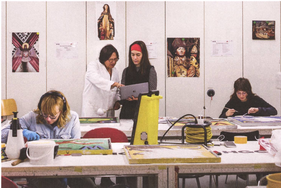
Abb. 2: Studierende arbeiten an den abgenommenen Bildfeldern im Atelier der Hochschule der Künste Bern.

Vordergrund und im Falle einer Wandmalerei zusätzlich den Erhalt in situ im architektonischen Kontext. Werte wie «Authentizität» und «Einheitlichkeit», ebenso «minimale Eingriffe» spielen eine übergeordnete Rolle in der Konservierung und Restaurierung von Kunstwerken in historischen Bauten. Überlegungen zu immateriellen Bedeutungen des Kulturerbes werden in der Regel weniger berücksichtigt. 1