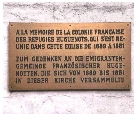
Plaque commémorative à l'Église française de Berne.

Cette publication comprend un aperçu historique approfondi et les textes des étapes fournissent de nombreuses informations intéressantes sur le patrimoine huguenot le long de l'itinéraire. À certains endroits, l'itinéraire culturel s'écarte de la route historique pour atteindre des lieux qui