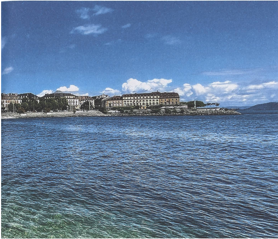
La baie de l'évole à Neuchâtel. L'itinéraire « Sur les pas des Huguenots et des Vaudois du Piémont » longe pour une grande partie les cours d'eau sur lesquels les réfugiés se déplaçaient autrefois.