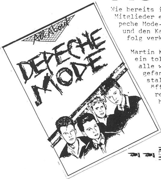
Das Sonderheft "All About Depeche Mode"