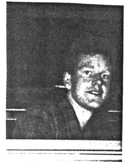
Fletch's Blick aus dem Bus - Fenster