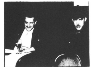
YELLO alias MEIER/BLANK

Was nur, macht eine Gruppe, die einfach NIEMAND mehr hören will und deren unverkaufte Singles sich zu Türmen stapeln? A FLOCK OF SEAGULLS (die mit Wishing) zeigen uns da