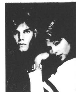
PIA ZADORA versucht's jetzt als Filmstar