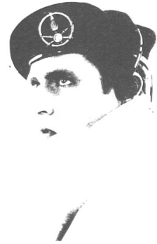
SIMON DE NOTRE DAME

die verblüffende Lösung: Man rafft alle verbliebenen Singles zusammen, tut das ganze in eine lustige Schachtel, schreibt irgendwas von Singlecollection und limitierter Auflage drauf, und schon reissen sich die gleichen Fans um die alten Scheiben, die vorher nie mehr eine FLOCK OF SEAGULLS-Single angerührt hätten. Clever, hä! Ganz so neu ist die Idee allerdings auch wieder nich. U2 haben das ganze schon vor 2 Jahren durchgegeben, mit ebensogrossem Erfolg.