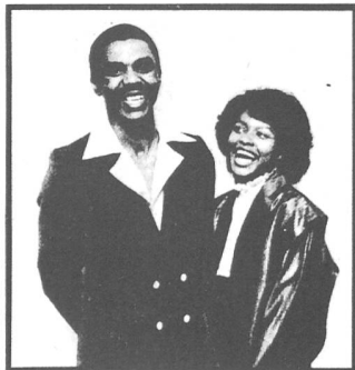
...und ein fröhlicher Ike Junior vor'm grossen Absahnen