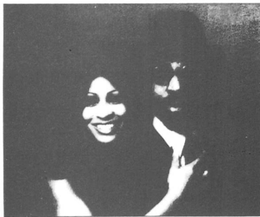
Ein Bild aus glücklichen Ike & Tina Turner - Tagen.