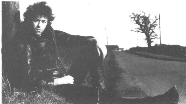
BOB GELDOF - Probleme mit der äthiopischen Regierung