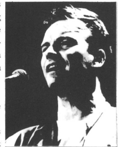
STING - Pionier im Filmbusiness