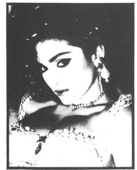
MADONNA CICCONNE - Gesprächsstoff des Monats