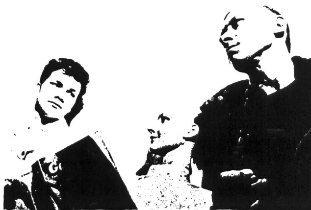
In eigener Sache: SKANDAL BEI NEW LIFE!?!

Von der LP "My Translucent Hands" erschien eine limitierte Auflage in durchsichtigem Vinyl (in England!). Ausserdem sind sämtliche Singles und die Mini-LP in Deutschland auch in farbigem Vinyl erschienen.