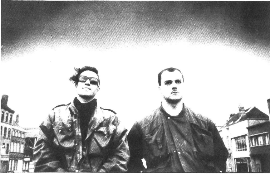
S.3 EVETS und J.3 SEUQCAJ aus der belgischen Industrie-Metropole Charleroi, besser bekannt unter dem Namen à;Grumh... sind zur Zeit ganz klar der Act auf dem Hardcore-Sektor. Das längste überfällige Interview mit den bösperversen Grosstadt-Neurotikern folgt in NEW LIFE No. 36