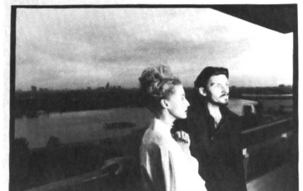
DEAD CAN DANCE