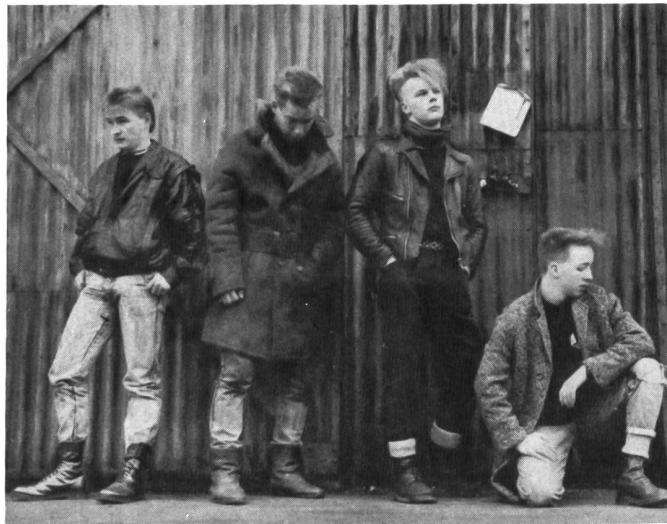
S E C O N D V O I C E