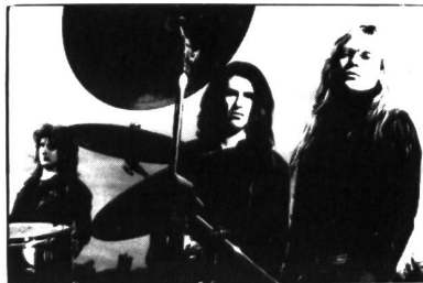
New Model Army im Interview

In dieser Ausgabe findet Ihr Berichte über die SIMPLE MINDS, Martin Eicher, The Silencers sowie Interviews mit FRONT 242, Nitzer Ebb, New Model Army, Cassandra Complex, The Fixx und Phillip Boa. Was wollt Ihr noch mehr? Was? Eine Gratis-Single wird gewünscht? No problem! Carlos Perón's tiefgründig ironische Persiflage auf das Musicbusiness, die Single "A Hit Song" liegt bei.