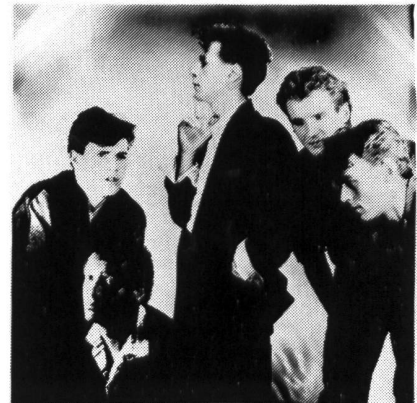
THE SILENCERS ...im Sommer auf Tour mit den Simple Minds