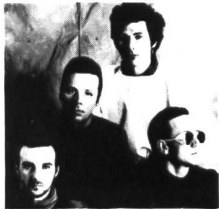
Ultravox versuchens wieder