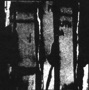
MUSLIMGAUZE - UZI

NOCTURNAL EMISSIONS - STONEFACE AMBIENT - INDUSTRIAL - AVANTGARDE PHOE 01 - LP & CD - SPV 08 84-1100 1