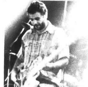
PALE SAINTS/BAND OF HOLY JOY/ EINSTÜRZENDE NEUBAUTEN 19.09.1989 - London - Astoria Theatre