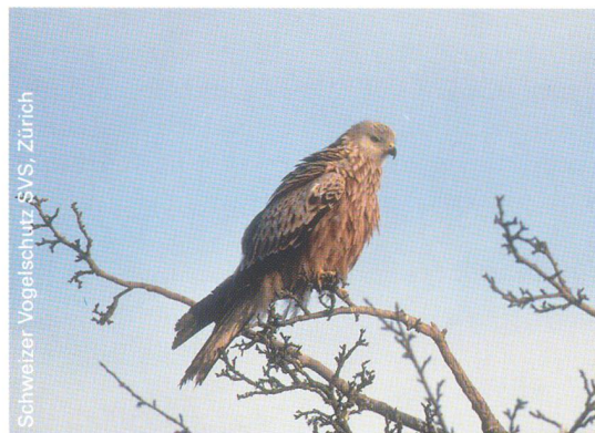
Schweizer Vogelschutz SVS, Zürich

Rotmilane bevorzugen als «Steppenvögel» reich strukturierte, offene Landschaften der Niederungen. Der Horst wird am Waldrand