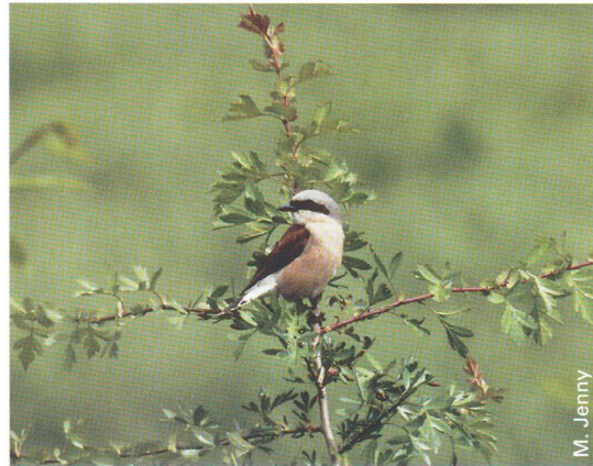
◀ Ein Neuntöter-Männchen auf einem Weissdornstrauch. Dornige Sträucher sind ein wichtiges Element im Lebensraum dieses Heckenvogels.

Der Neuntöter ist ein typischer Bewohner von Heckenlandschaften. Wichtig ist dabei das Vorhandensein von Dornensträuchern. Das Nest wird bevorzugt in solchen Dornensträuchern angelegt. Zudem wird in diesen auch gerne die Beute aufgespiess. Um genügend Nahrung zu finden, ist der Neuntöter auf extensive Wiesen, Weiden, Krautsäume oder andere Randstrukturen in der Nähe der Hecken angewiesen. Seltener werden auch Jungwuchsflächen im Wald sowie strukturreiche Waldränder besiedelt. Die Nahrung des Neuntötters ist sehr vielseitig: Neben grossen Insekten werden verschiedene kleinere Tiere, auch Mäuse, erbeutet. Aufge-