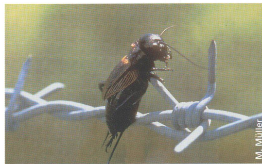
◀ Ein typisches Verhaltensmerkmal beim Neuntöter ist das Aufspiesern von Beutetieren. Dies ermöglicht ihm, die Beute leichter zu zerteilen. Zudem kann er sich so auch einen Vorrat für schlechte Zeiten anlegen.