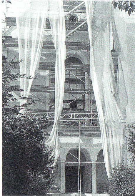
August 1991. Durch den Staubvorhang...

Inneres, Äusseres und Umgebung der Andreas-Kirche haben sich in der kurzen Zeit seit 1987 baulich stark verändert: Anbau (Chororgel-Empore), Umbau (Chor), Abbau (Kanzel), Aufbau (Altäre, Turmkreuz), Einbau (Beichtstühle, Beleuchtungskörper) usw. «Gemeinsam an der Kirche bauen – gemeinsam in die Zukunft schauen», so das Jubiläumsmotto von 1987, hat sich zwischenzeitlich sichtbar ereignet. «Der kluge Mann baut vor», heisst es, wenn er eine Existenz «aufbauen», an seiner Zukunft «bauen» will. Unsere Sprache verrät es: wir alle sind Bauleute: «Gemeinsam an der Kirche bauen»: mitdenken, Vorschläge einbringen, diskutieren, Grundsatzüberlegungen, Anregungen und Vorbehalte anbringen in Zeitungsleserbriefen und Versammlungen, am Stammtisch, bei Informationsanlässen und im spontanen Gespräch. Eine bevorstehende Kirchenrenovation erregt immer die Gemüter, kann gar irrationale Ängste hochkommen lassen. Erwartungen, Wünsche, Freude, aber auch Skepsis und Bedenken dürfen von allen geäussert werden. Dass die Kirchenrenovation dann nicht «auf Sand gebaut» wurde, ist nicht zuletzt der breiten Basis zu verdanken, die sozusagen als festes Fundament an der Abstimmungsver-