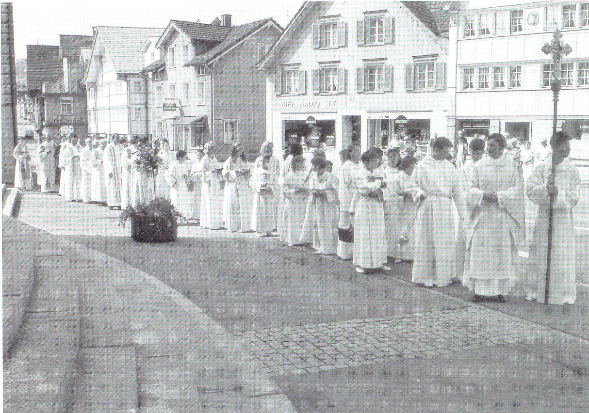
Feierlicher Einzug in die restaurierte Kirche

fügen, den der Geist Gottes baut» (1 Petr. 2.5), denn «ihr seid das erwählte Volk von Königen, die Gott als Priester dienen, ein heiliges Volk, das Gott selbst gehört» (1 Petr. 2.9).