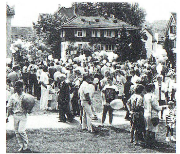
Nach dem Festgottesdienst Apéro mit Spiel und Plausch

Seit Ezechiels Traum sind viele neue Tempel gebaut und geweiht worden. Ihr Zweck bleibt bis heute der gleiche: dass aus ihnen Wasser fliesse, das überall Leben entstehen lässt. Wir brauchen einen Tempel, von dem lebendiges Wasser kommt, und wir brauchen jenes Wasser, das nicht aus einem toten Tempel aus Stein entspringen kann. Wenn auch erst am Ende der Zeiten vollendet, ist der erträumte Tempel wenigstens umrisshaft in der Andreas-Kirche schon jetzt sichtbar. Möge er auch jetzt schon wirksam sein, Leben ermöglichen, dem Leben dienen, Gott erfahren lassen als den «Liebhaber des Lebens» (Weish. 11.26).